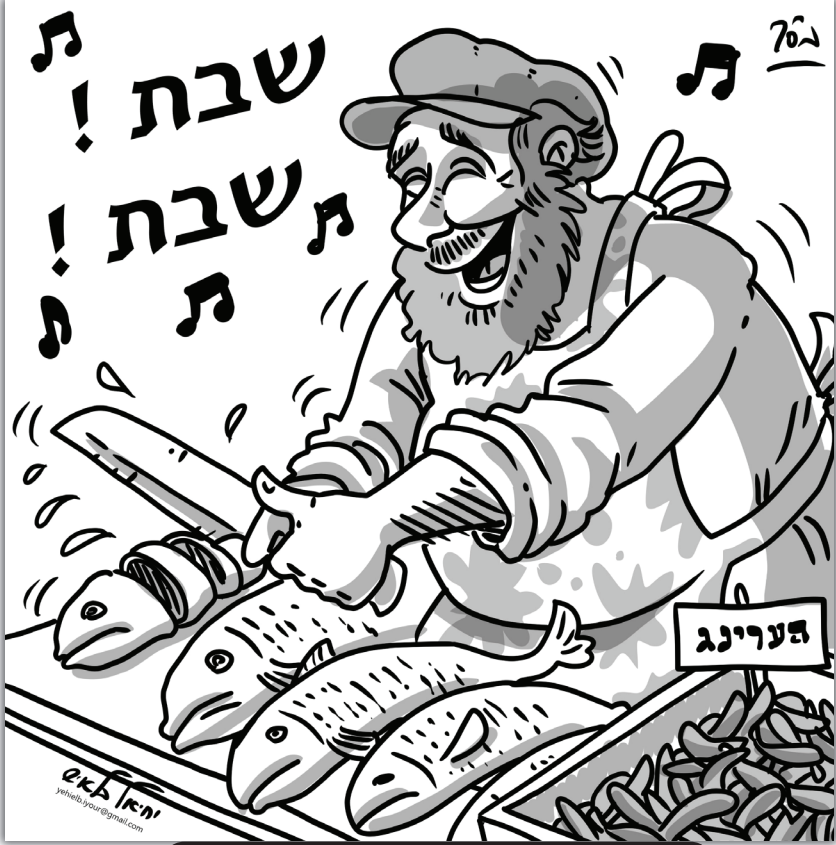
”דגים לכבוד שבת!”

ילדים, אם יגישו ממתקים טעימים אתם תזכרו לומר: “לכבוד שבת?” כל הילדים אומרים: “כן! בטח! אנחנו הולכים לומר ‘לכבוד שבת’ על כל ממתק בנפרד”.