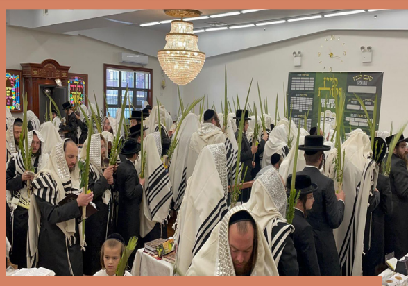
הושענה רבה תשפ"ב ביים ראש ישיבה שליט"א