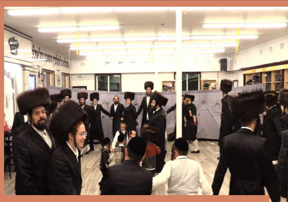
פרייליכע טענץ ביי דעם יארצייט פון הייליגן רבין - דאנערשטאג חול המועד אין שטעטל