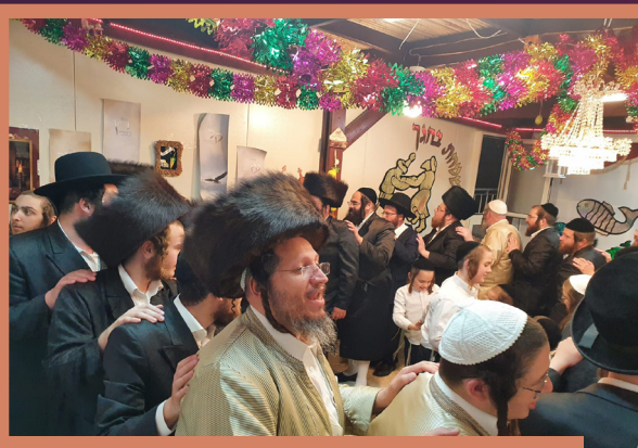
יארצייט פון הייליגן רבין דאנערשטאג חול המועד - אין היכל הקודש ברסלב ירושלים