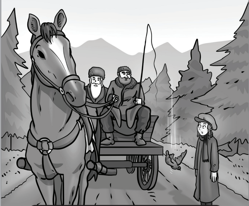
די פייגל איז געווען א גלגול פון א נשמה

ווייל ער זעט גוט; ווייל די פייגל איז געווען א גלגול פון א נשמה וואס האט יעצט באקומען איר תקון.