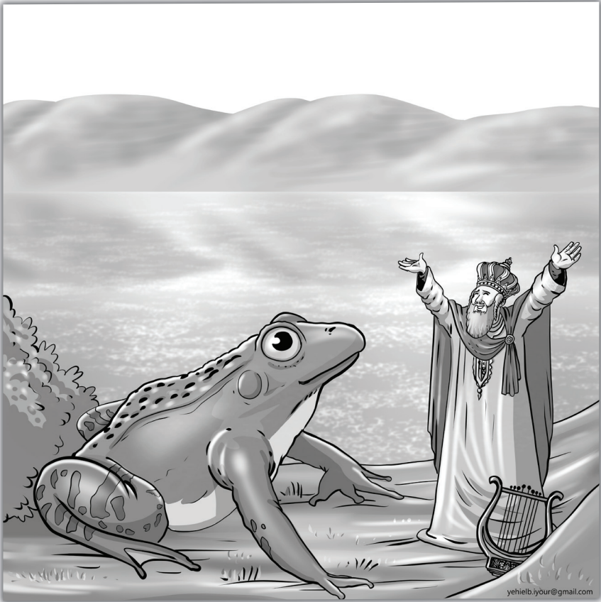
אֲנַחְנוּ הַצְּפַרְדֵּים אוֹמְרֵת שִׁירוֹת וְתִשְׁבְּחוֹת לַהַשֵּׁם יִתְבָּרֵךְ יוֹמָם וְלַיְלָה!

כָּל דְּבַר הוּא בְקֶשׁ מֵהַשֵּׁם יִתְבָּרֵךְ וְעַל כָּל דְּבַר הוּא הָיָה מְשַׁבַּח אֶת הַשֵּׁם יִתְבָּרֵךְ. פְּתֹאֹם קוֹפְצֵת מִתּוֹךְ הַכְּנֶרֶת צְפַרְדֵּי, לֹא צְפַרְדֵּי קִטְנָה, צְפַרְדֵּי עֲנֻקִית! הַצְּפַרְדֵּי מִתְחִילָה לְקַרֵּקֵר. דְּוֵד הַמֶּלֶךְ לֹא נִבְהַל, דְּוֵד הַמֶּלֶךְ חֵי עִם אֱמוּנָה חֲזָקָה. גַּם יְלָדִים שְׂיֻדְעִים שֶׁהַקְּדוֹשׁ בְּרוּךְ הוּא נִמְצָא כְּאֵן, אַף אֶחָד לֹא יִכּוֹל לַעֲשׂוֹת לִי כְּלוּם' - גַּם הֵם לֹא נִבְהָלִים מִשׁוּם דְּבַר.