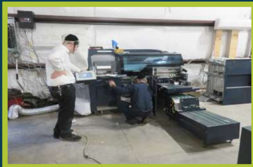
מען פאררעכט איינע פון די מאשינען אין בית הדפוס