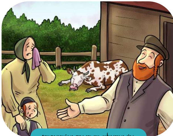
אוי גענאלד, די קו איז געטארקן!

רבי אהרן קומט אהיים און הייבט אן טאנצן: "שפּח אײבערשטער!" "שפּח אײבערשטער!" "שפּח אײבערשטער!" אהרן - שרייט זיין ווייב - "וואס איז מיט דיר געשען, פארוואס טאנצטו? דו זעסט נישט אז דער קו איז טויט?! פון וואו וועלן מיר האבן פּרנסה?" רבי אהרן זאגט איר: "טאקע פארדעם טאנץ איר; איר דאנק דעם אײבערשטן אז די