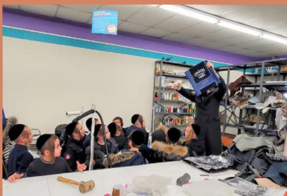
ביים ווייזן א פערטיגן טלית ביטל מיטן ברסלב קרוין