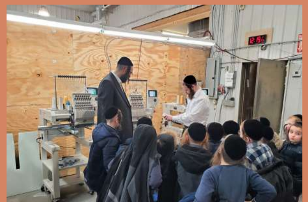
מען קוקט צו וויאזוי מען מאכט א טלית ביטל