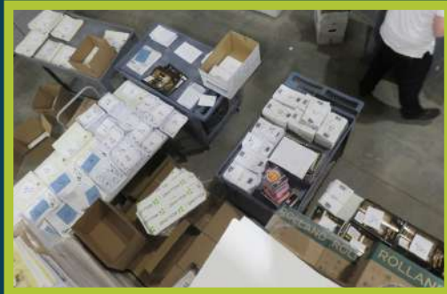
מען גרייט אן די גליונות ארויסצושיקן פאר אלע מפיצים