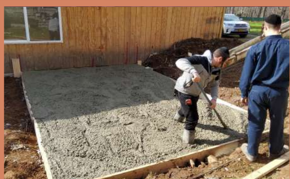
קרית ברסלב ליבערטי - מצה בעקעריי מען גיסט סעמענט ביים פלאץ וואו די מצה אויוון וועט ווערן אראפגעלייגט, אזוי אויך גרייט מען צו דעם פלאץ אינעם בנין.