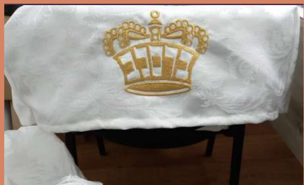
נייע טישטיכער מיטן ברסלב קרוין הערליך אויפגענייעט פארן בית המדרש היכל הקודש ירושלים עיר הקודש