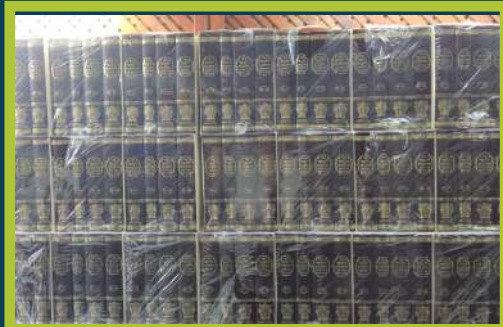
יינע סעטס ליקוטי הלכות אנגעקומען אין הפצה סענטער ירושלים