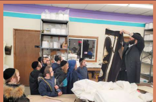
ביים צייגן א הערליכע פרוכת פאר א ארון קודש