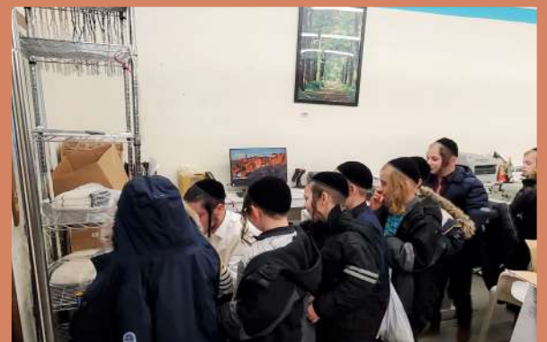
מען קוקט וויאזוי מען קניפט ציצית