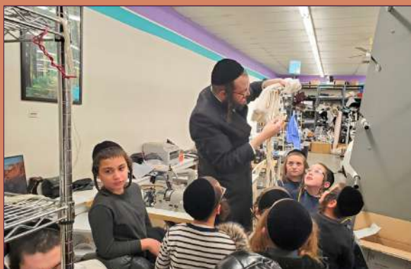
הערליכע בלויע געקניפטע ציצית