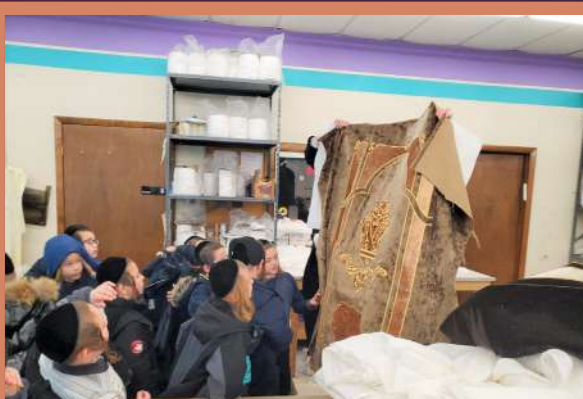
ביים צייגן א הערליכע פרוכת וואס ווערט געמאכט אין די טעג