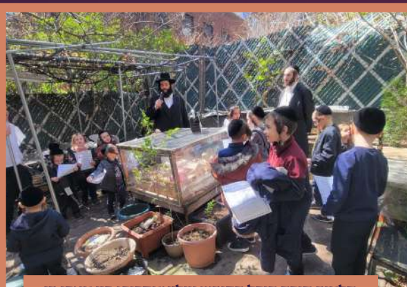
תלמוד תורה היכל הקודש וויליאמסבורג ביי מאכן די ברכה אויף די ביימער - ה' אחרי ב' תשפ"ב