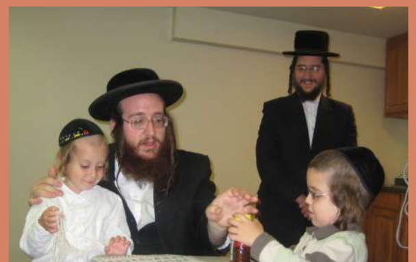
אפשערן פון נפתלי נ"י בן ר' עזרא בוים הי"ו