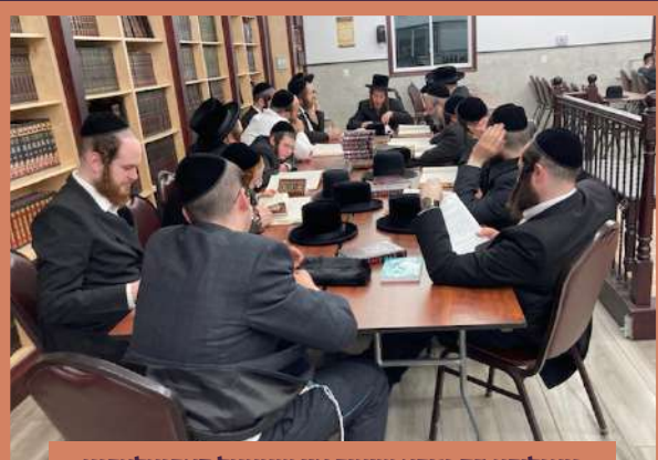
טעגליכע דף גמרא שיעור אין שטעטל פארגעלערנט דורך דעם דיין שליט"א