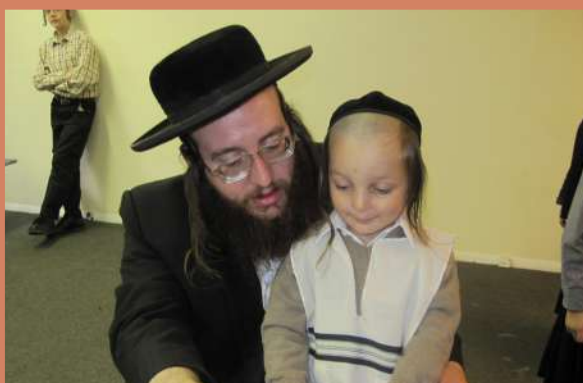
אפשערן פון שלום נ"י בן ר' משה ארי' שניטצלער הי"ו