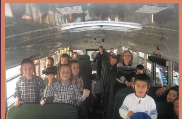
די קינדער אויף די באס