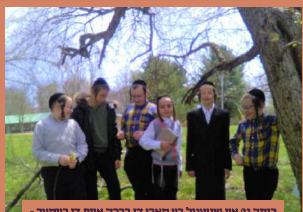
כיתה ט' אין שטעטל ביי מאכן די ברכה אויף די ביימער - א' קדושים תשפ"ב