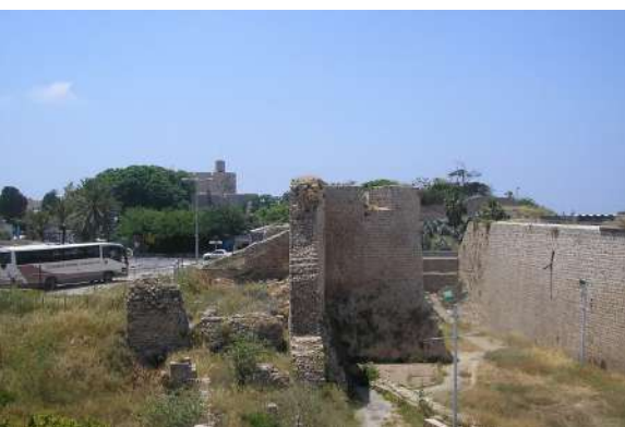
אלטע מויער געבליבן פון שטאט עכו

זיי האבן זיך דערמאנט אז ווען זיי זענען ארויף אויפ'ן שיף פון חוץ לארץ קיין ארץ ישראל, האבן זיי געהאט אנגעגרייט גענוג און נאך עסן פאר א פיר פינף חדשים, אזוי ווי מ'נעמט געווענליך מיט ווען מ'לאזט זיך ארויס אויפ'ן ים, אבער יעצט האבן זיי ממש גארנישט געהאט.