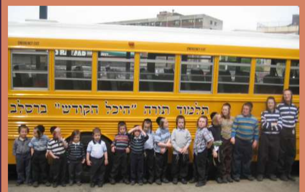
די קינדער שטייען אין פארנט פונעם ערשטן באס