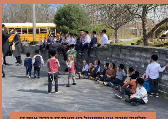
תלמוד תורה אין שטעטל ביי מאכן די ברכה אויף די ביימער - א' קדושים תשפ"ב