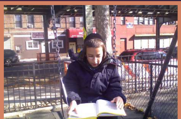
הערשי בוים נ"י (יבנאל) לערנט משניות אין פארק