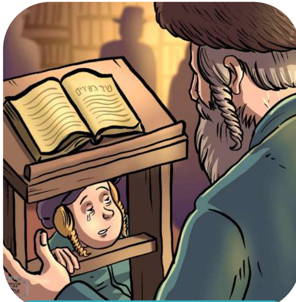
איך וויל אויך שפירן א טעם אינעם שבת

אבער דער רבי האט דאס נישט געטון אלץ נארישע קינדרישע זאכן, דער רבי איז געווען אינעם שטענדר און געוויינט, ער האט געוויינט: "הייליגער באשעפער, איך וויל אויך שפירן א טעם אינעם שבת, הייליגער באשעפער, איך וויל זיין א צדיק", דער רבי איז דארט געווען א לאנגע צייט.