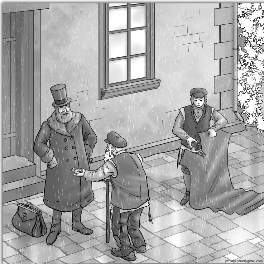
הוא התנהג מאד לא יפה לאבא שלו

הבגד, שאל אותו האבא: "למה גזרת את הבגד לשני חלקים?" אז אמר לאבא שלו: "חלק אחד אני שומר בשבילך, כשאתה תהיה זקן אזרק אותך מהבית, וכשיבוא החורף ויהיה לך קר - אשלח לך את החלק השני של הבגד."