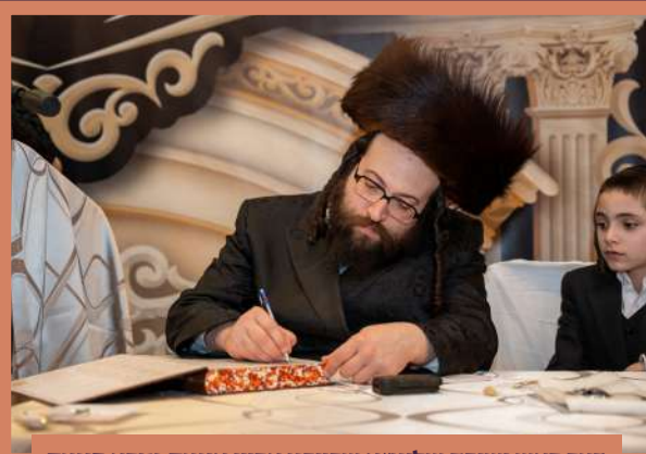
דער ראש ישיבה שליט"א שרייבט אריין אינעם גמרא פונעם נדבן פון די גמרות וואס מען האט אויסגעטיילט