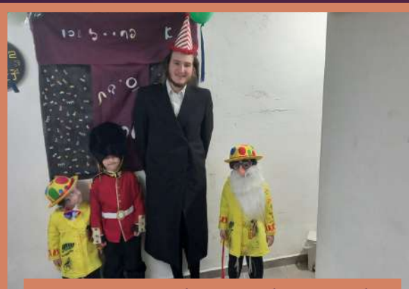
תלמוד תורה היכל הקודש ירושלים - ערב פורים תשפ"ב