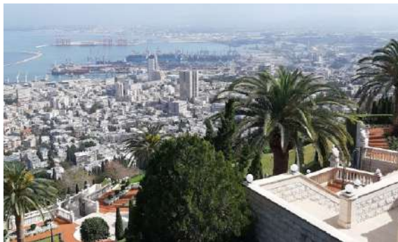
די שטאט חיפה היינטיגע צייטן

דער רבי איז געווען דער ערשטער וואס האט נישט געקוקט אויף דעם, ער איז יא אריינגעגאנגען אהין, ס'איז געווען דארט אַ ווארצל פון אַ בוים וואס איז געלאפן אין די מערה, און דער רבי האט זיך אָנגעכאפט אויף דעם ווארצל און איז אזוי אריין, און ס'איז נישט געווען קיין שום שלאנג דארט. און פון דעמאלט און ווייטער האבן מענטשן אָנגעהויבן אריינצוגיין אהין און קיין פחד. אזוי זענען אַרומגעגאנגען צו אַלע מערות, און דערנאך האבן זיי זיך צוריק געקערט קיין טבריה.