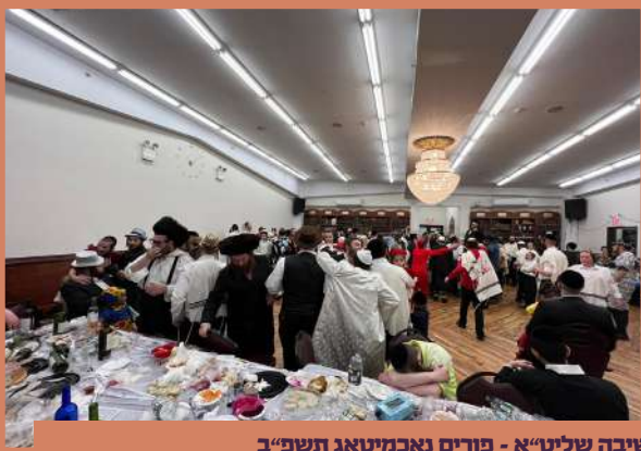
פרייליכע טענץ אין ישיבה צוזאמען מיטן ראש ישיבה שליט"א - פורים נאכמיטאג תשפ"ב