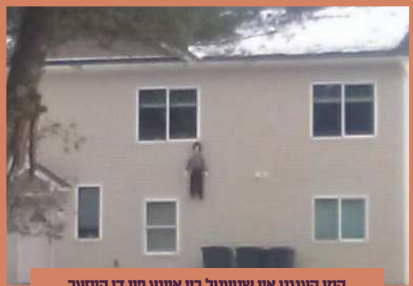
המן הענגט אין שטעטל ביי איינע פון די הייזער