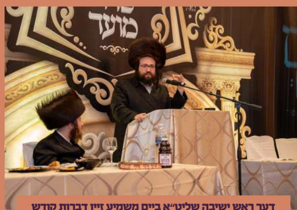
דער ראש ישיבה שליט"א ביים משמיע זיין דברות קודש