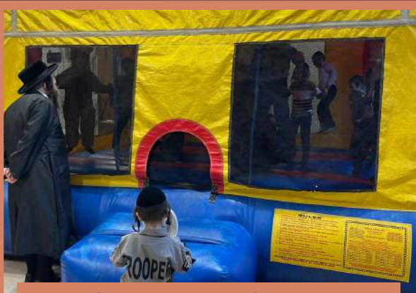
דער ראש ישיבה שליט"א באזוכט אין שטעטל חדר ערב פורים - ג' ויקרא תשפ"ב