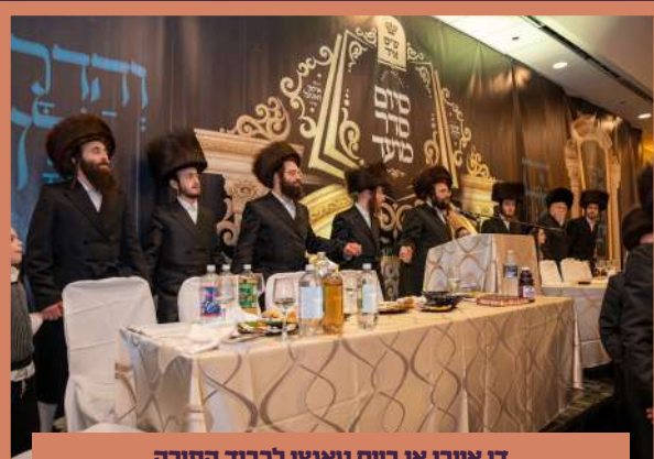
די אויבן אן ביים טאנצן לכבוד התורה