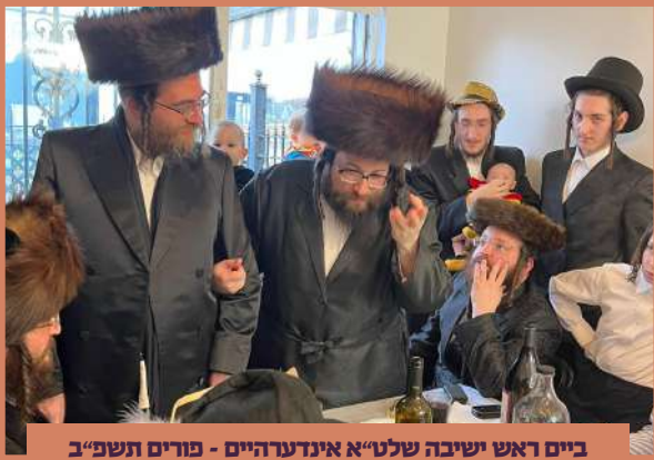
ביים ראש ישיבה שליט"א אינדערהיים - פורים תשפ"ב