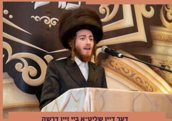
דער דיין שליט"א ביי זיין דרשה