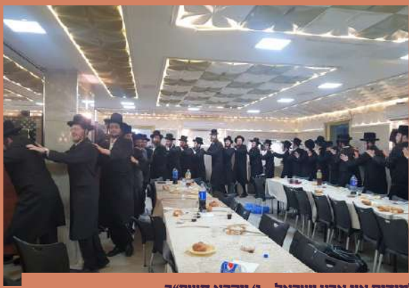
הערליכע סיום סדר מועד אין בני ברק פון אלע תלמידים אין ארץ ישראל - ג' ויקרא תשפ"ב