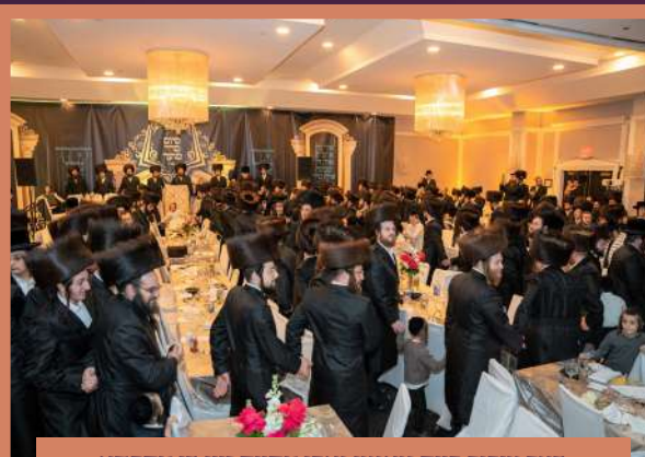
דער ציבור ביים טאנצן נאכן מסיים זיין די מסכתא