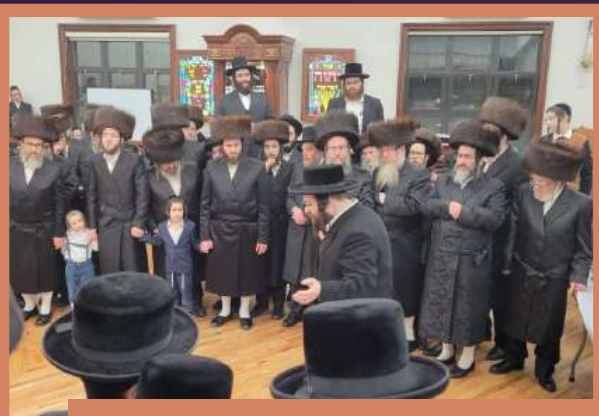
דער ראש ישיבה ביים טאנצן מיטן חתן און ביים טאנצן מצוה טאנץ - ג' ויקרא תשפ"ב