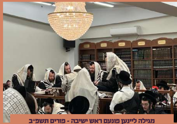
מגילה ליינען פונעם ראש ישיבה - פורים תשפ"ב