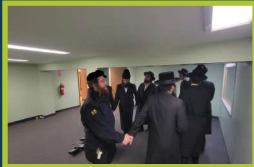
ביים טאנצן נאך מנחה אינעם נייעם בנין