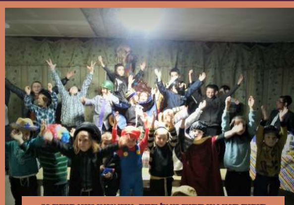
פורים קטן אין קרית יואל חדר, צוזאמען מיט כיתה ט' קינדער פון תלמוד תורה קרית ברסלב ליבערטי