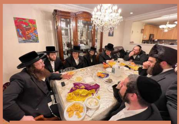
עצתו אמונה פארברענג אין וויליאמסבורג - ב' ויקהל