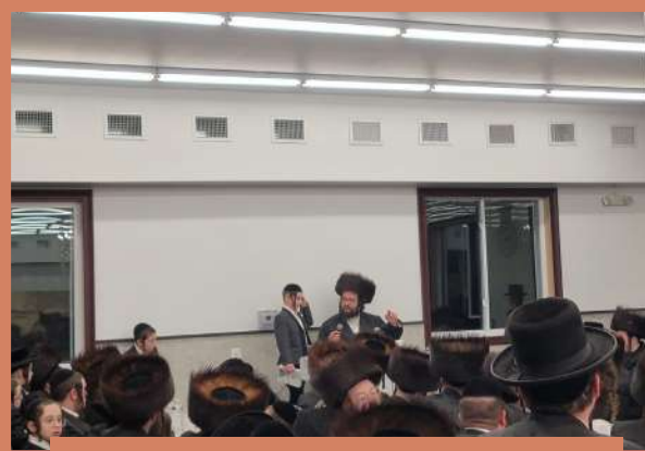
דער ראש ישיבה רופט ארויס איינע פון די קינדער וואס האט מסיים געווען אפאר מסכתות אין שי"ס