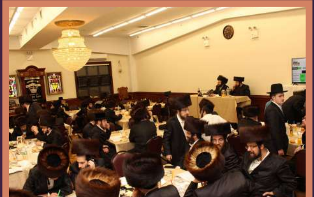
דער עולם ביים מלוה מלכה