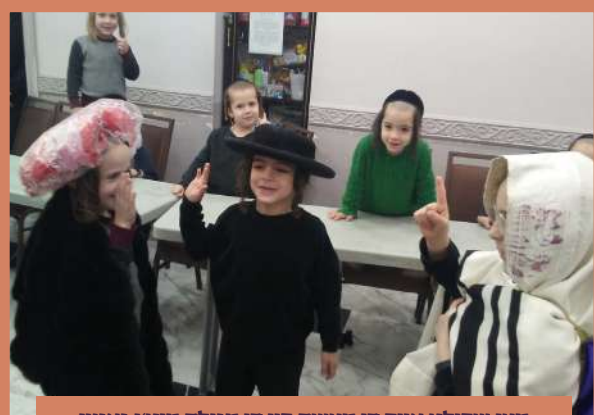
מען שפילט אויף די מעשה פון די מגילה מיטן גאנצן געשמאק