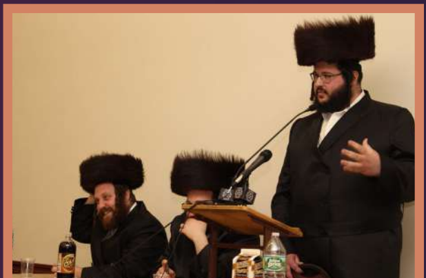
ר' מעכל ראזענפעלד הי"ד ביים געבן זיין דרשה