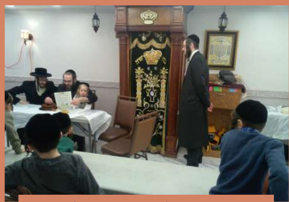
אפשערן פון בן ר' יואל פארקאש הי"ו אין תלמוד תורה היכל הקודש קרית יואל