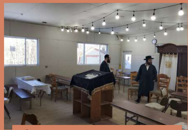
דער ראש ישיבה באזוכט בית המדרש אשר בנחל מאנטאג ויקהל תשפ"ב