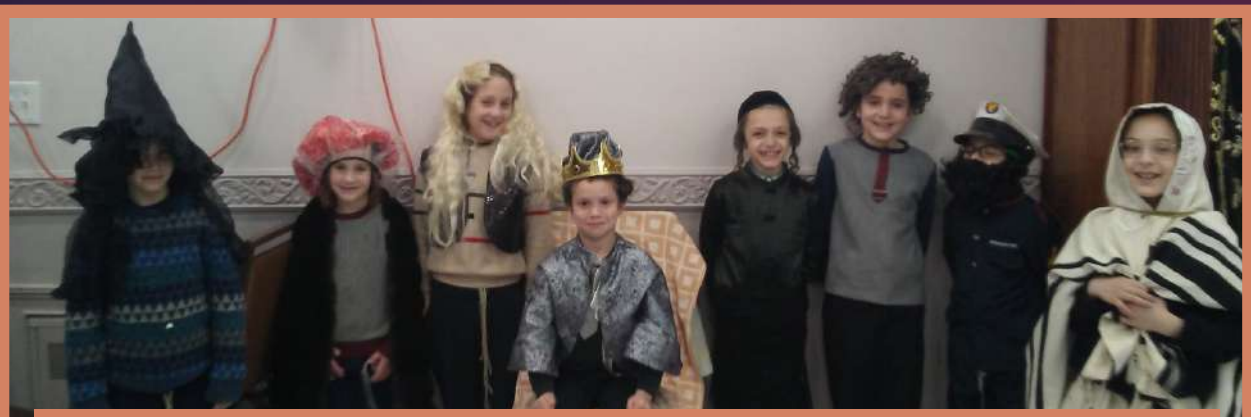
פורים קטן אין תלמוד תורה היכל הקודש קרית יואל, די קינדער האבן אהערגעשטעלט א שפיל מיט פשוטע פארשטעלעכענסט, אינטערסאנט איז אז די קינדער זענען העכסט צופרידן, זיי דארפן נישט גארנישט.