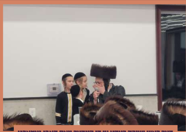
דער ראש ישיבה רעדט צו די קינדער וואס האבן געמאכט סיימים