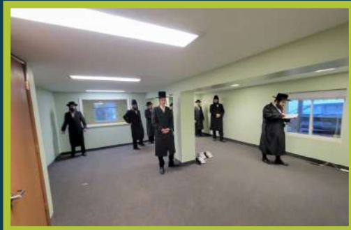
ביים דאווענען מנחה אינעם נייעם בנין