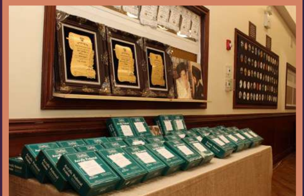
מתנות פאר די אינגעלייט וואס העלפן ארויס א גאנץ יאר