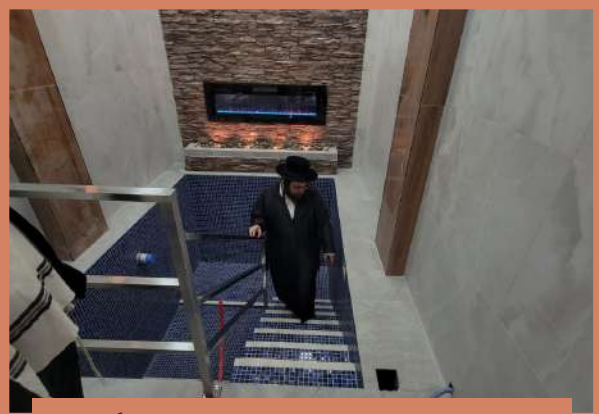
דער ראש ישיבה ביים מקוה אין שטעטל מאנטאג ויקהל תשפ"ב