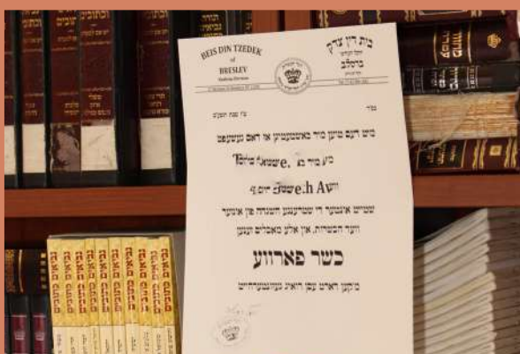
הכשר פון בית דין צדק ברסלב