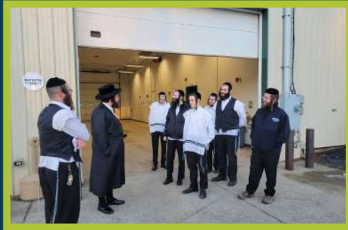
דער ראש ישיבה באזוכט ביים נייעם בנין - ב' ויקהל