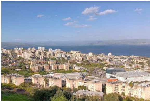
די שטאט טבריה היינטיגע צייטן

דער רבי האט אים געזאגט אז ער זאל זיך צוגעוואוינען צו זאגן תהלים, און דער רבי האט אים געזאגט, "אויב וועסטו קענען דא זאגן תהלים מיט גרויסע בכיות, אין פארנט פון אלע אינגעלייט דא, וועל איך זען אז דו האסט טאקע נישט קיין גאון אין דיר", און דער מסור האט טאקע אזוי געטון, ער האט גלייך אנגעהויבן זאגן דארט תהלים, און ס'איז אים גערינען טרערן פון די אויגן.