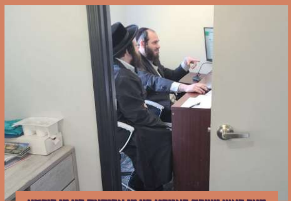
דער ראש ישיבה באזוכט ביי די אפיסעס פון די פירמע "פעסט בילד" וואס בויעט די הייזער אין שטעטל