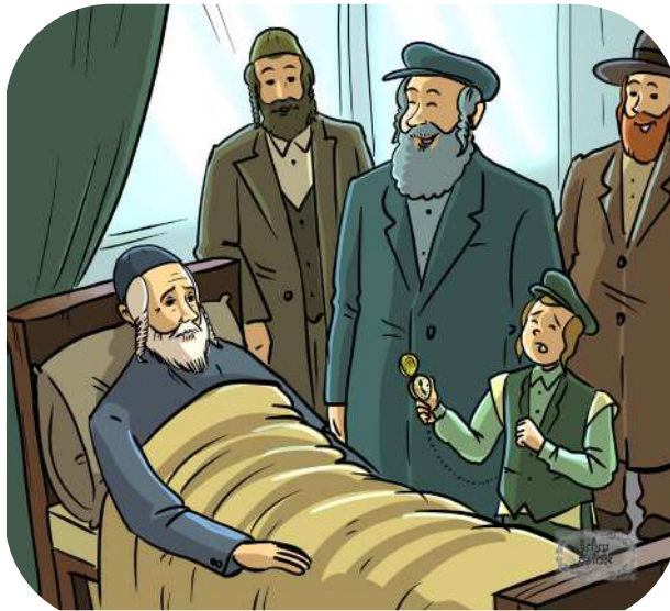
ישׂראליק בעט דעם אייבערשטן

די תלמידים האבן אלע געשמייכלט, זיי האבן פארשטאנען אז דאס איז נישט גענוג, נישט דאס מיינט בעטן דעם אייבערשטן; האט זיך דער הייליגער רבי אנגערופן צו זיי: “אזוי דארף מען בעטן דעם אייבערשטן; אזוי ווי