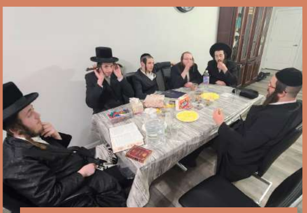
עצתו אמונה פארברענג אין שטעטל - ג' ויקהל