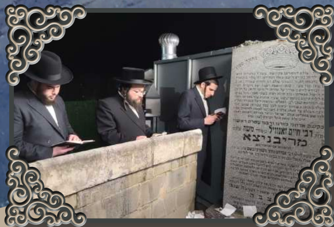
ביים ציון פון הרה"ק מריבניץ זי"ע ג' ויקהל

מעשיית פון תפלה: באצאלט דעם קאר מיט תפלה