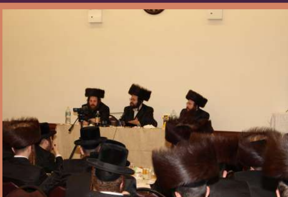
דער ראש ישיבה איז משמיע דברות קודש