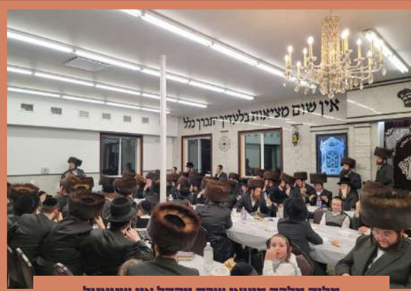
מלוה מלכה מוצאי שבת ויקהל אין שטעטל