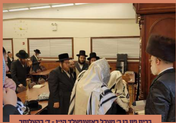
ברית פון בן ר' מעכל ראזענפעלד הי"ו - ד' בהעלותך