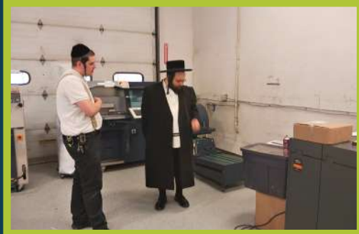
ביים באטראכטן די ארבעט אין בית הדפוס - ב' בהעלותך