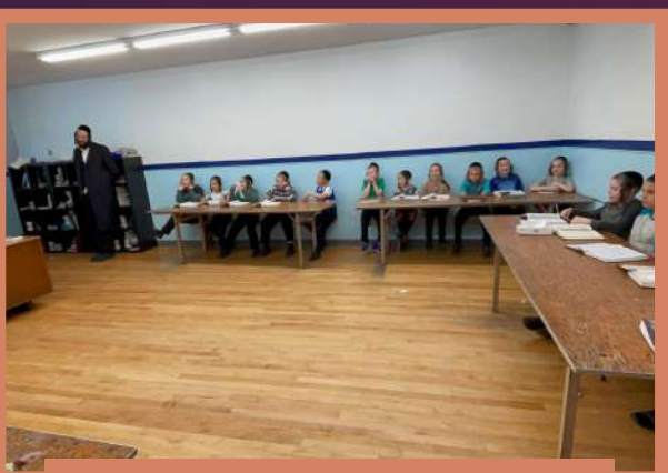
דער ראש ישיבה באזוכט אין שטעטל חדר כיתה ב' ב' בהעלותך