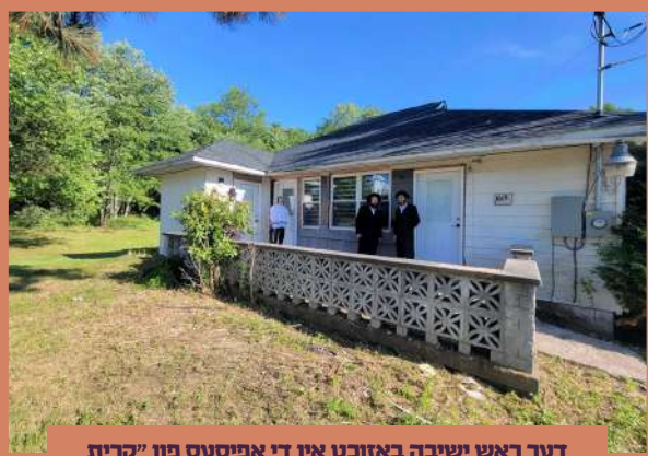
דער ראש ישיבה באזוכט אין די אפיסעס פון "קרית ברסלב סוויטס" - ב' בהעלותך