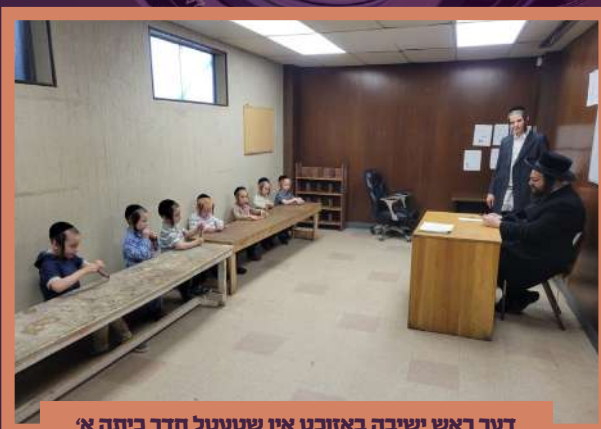
דער ראש ישיבה באזוכט אין שטעטל חדר כיתה א' ב' בהעלותך