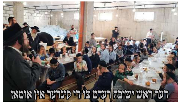
דער ראש ישיבה רעדט צו די קינדער אין אומאן

מיט גרויס התרגשות גרייטן זיך אנשי שלומינו צום קומענדיגן ראש השנה הבעל"ט. טראצדעם וואס מען האלט אין אזא אומזיכערע צייט, מדינות שלאגן זיך ארום איינע מיט די צווייטע, ציט יעד'ס הארץ און מען קען נישט אויפהערן בענקען צו זיין ביים הייליג'ן רבין אין אומאן אויפ'ן קומענדיגן ראש השנה.