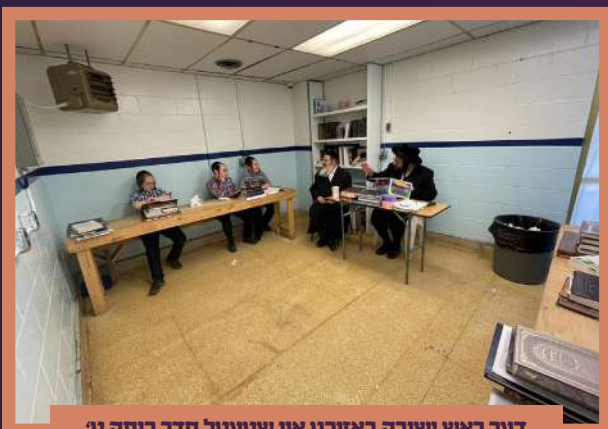
דער ראש ישיבה באזוכט אין שטעטל חדר כיתה ט' ב' בהעלותך