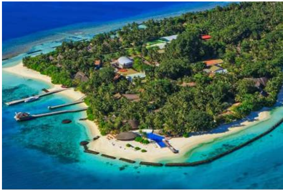
א שטאט אויפ'ן וואסער

דער רבי האט זיך זייער מצער געווען, ווי אזוי וועט ער דארט קענען זיין א איד און טון אלע מצות. ער האט אנגעהויבן אריינצוטראכטן אין דעם, ביז ער האט זוכה געווען משיג צו זיין ווי אזוי ער וועט קענען דינען דעם אייבערשטן אפילו אויב ער וועט חס ושלום נישט האבן די מעגליכקייט מקיים צו זיין מצות. ער האט משיג געווען די עבודה פון די הייליגע אבות ווי אזוי זיי האבן מקיים געווען אלע מצות נאך פאר מתן תורה, כאטש וואס זיי האבן נישט געטון אלע מצות בפשטות. אזוי ווי ס'ווערט געברענגט אויף יעקב אבינו אז ער האט מקיים געווען די מצוה פון תפילין דורך די שטעקענעס וואס ער האט אפגעשיילט ביי די בהמות "ויצג את המקלות אשר פצל ברהטים בשקתות המים" (בראשית ל', ל"ח), ווי ס'ווערט געברענגט אין זהר הקדוש (חלק א', קסב), און אזוי ווייטער האט ער משיג געווען ווי אזוי ער וועט מקיים זיין אלע מצות אויף דעם אופן, אויב ער וועט זיין אן אונס, ער וועט חס ושלום נישט האבן א וועג ווי אזוי צו טון די מצות געהעריג.