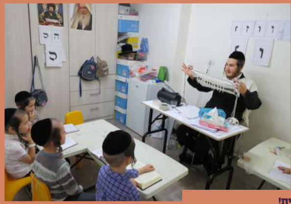
א מחי ציצית! תלמוד תורה היכל הקודש ירושלים