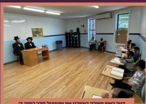
דער ראש ישיבה באזוכט אין שטעטל חדר כיתה ד' ב' בהעלותך