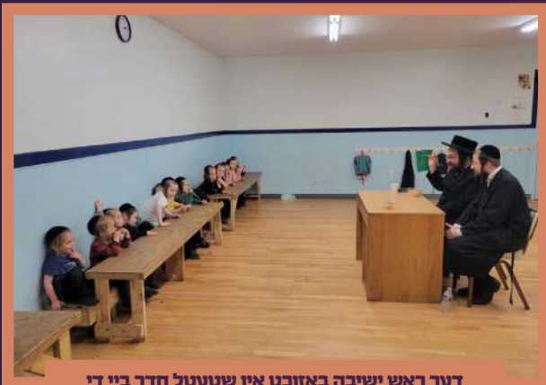
דער ראש ישיבה באזוכט אין שטעטל חדר ביי די קלענסטע קלאס - ב' בהעלותך