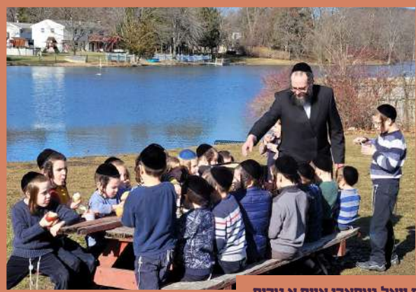
תלמוד תורה היכל הקודש קרית יואל געפארן אויף א טריפ