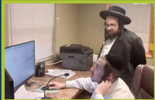
דער ראש ישיבה באזוכט אין אפיס פון בית הדפוס - ב' בהעלותך