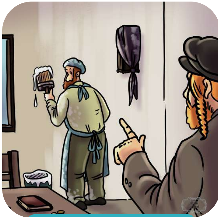
נישט מיט א טיכל זאלסטו דאס צודעקן

א י י נ מ א ל האט מען געפארבט דעם רבי'ס הויז, עס איז געווען אין די טעג פאר דעם יום טוב פסח, מען האט איבערגעפארבט די שטוב פון רבי'ן, און רבי נתן דער געטרייער תלמיד האט געהאלפן מיט אלעס וואס