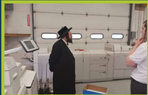
ביים אדורך גיין די דעטאלן פון די טעגליכע ארבעט - ב' בהעלותך