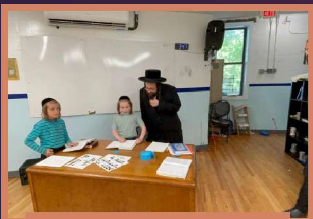
ביים פארהערן די קינדער