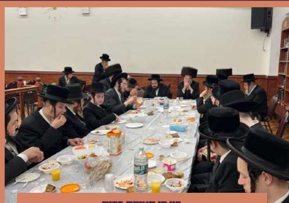
ביי די סעודת ברית