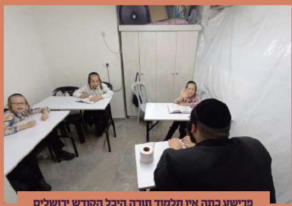
פרישע כנה אין תלמוד תורה היכל הקודש ירושלים