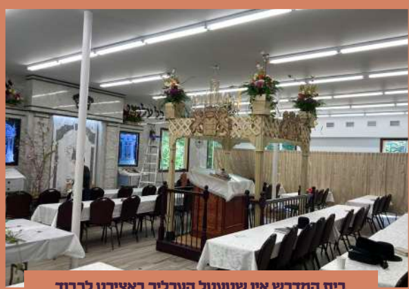
בית המדרש אין שטעטל הערליך באצירט לכבוד שבועות