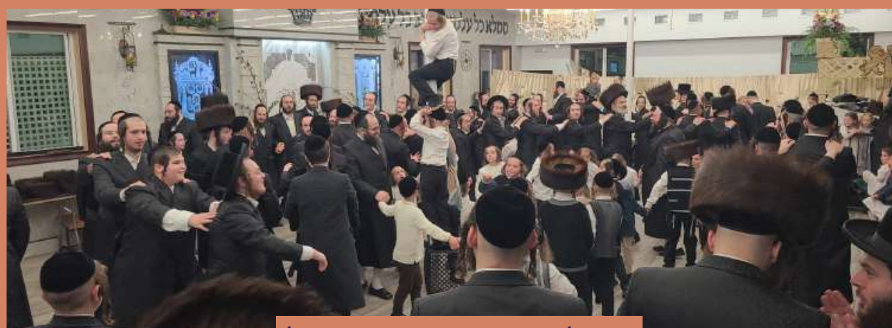
גאר פרייליכע טענץ מוצאי יום טוב שבועות אין שטעטל