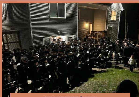
קידוש לבנה מוצאי יום טוב