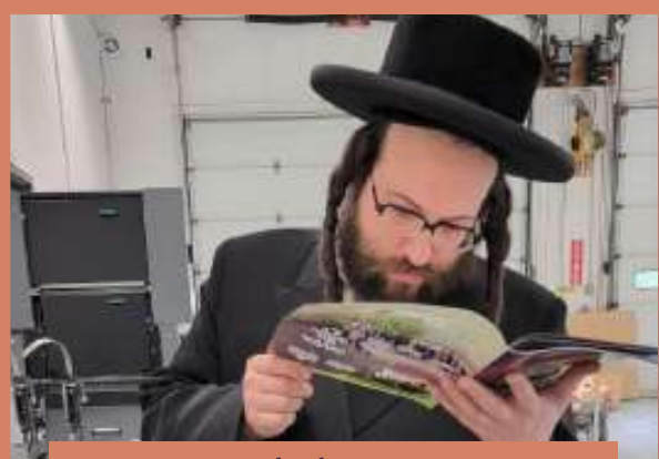
ביים אדורך קו דעם בלעטל אין בית הדפוס