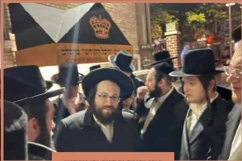
אין חצר הבית המדרש