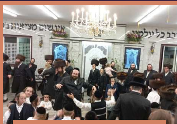
ווער קען מאכן א קאדאטשקע?