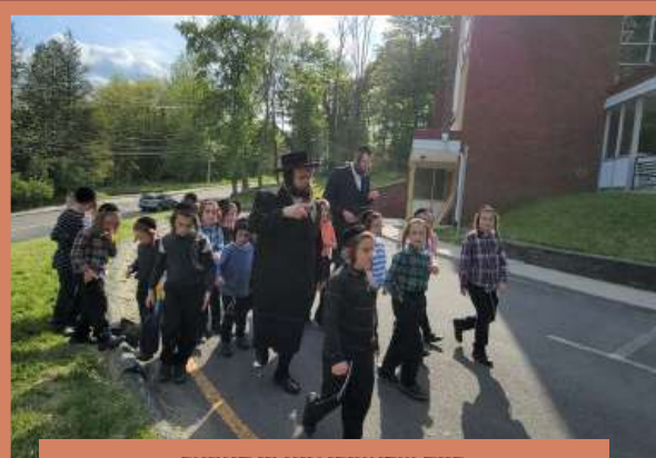
ביים שפאצירן מיט די קינדער