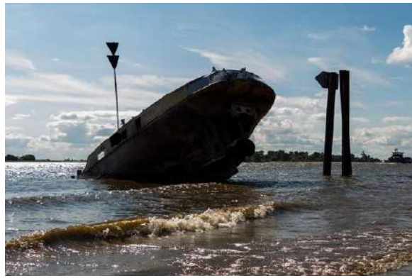
שטורעמישע וואסערן דרייען כמעט איבער דעם שוף

דאנערשטאג מיטאג, אום צוועלף זייגער, האט מען אנגעהויבן ארויסצושעפן די וואסער וואס האט פארפלייצט דעם שוף, זיי האבן ארויסגעצויגן די וואסער פונם דריטן אפטיילונג מיט די פלאמפן, אזוי ווי דער סדר איז.