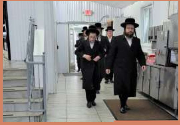
מתפלל ביים אהל מיט די בחורים - ערב שבת בחוקותי