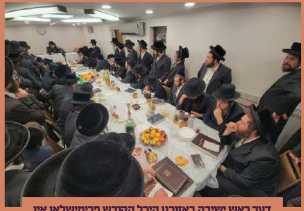
דער ראש ישיבה באזוכט היכל הקודש פרימישלאן אין קרית יואל - מאנטאג במדבר ר"ח סיון