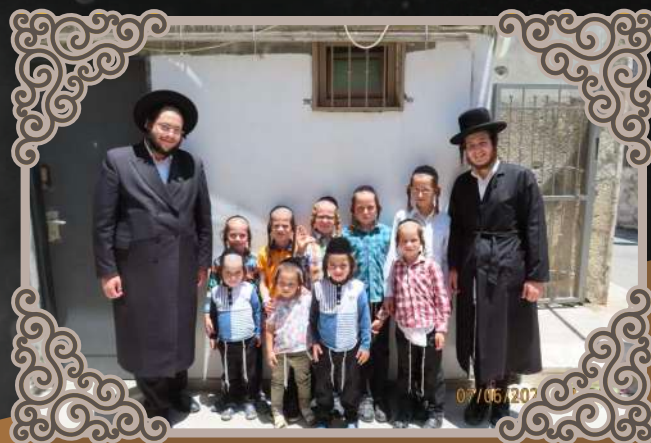
פרישע תלמידים אין תלמוד תורה היכל הקודש ירושלים

א סעודה מיטן ראש ישיבה; אפילו אין די היצן גיי איך אויך דאווענען ביים רבי'ן