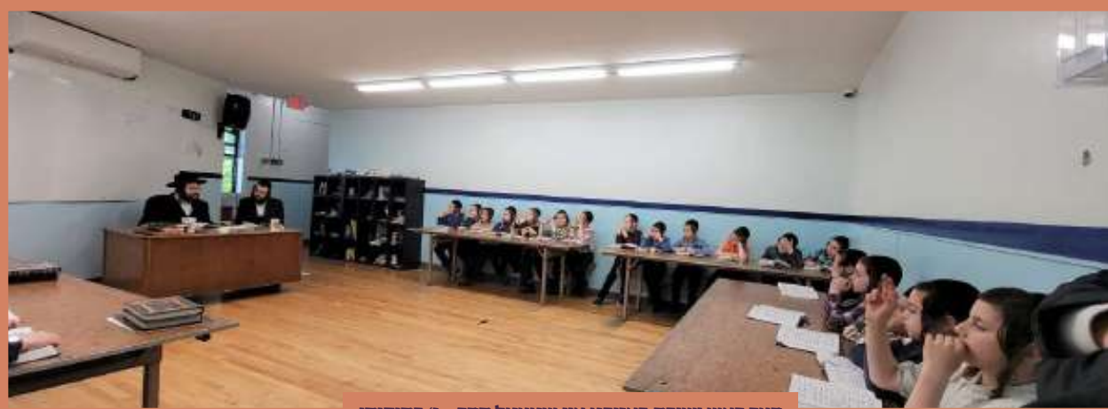
דער ראש ישיבה באזוכט אין שטעטל חדר - ג' בחוקותי