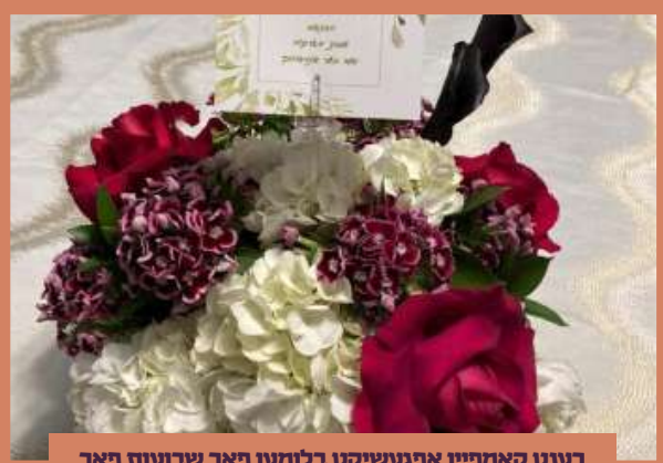
רענט קאמפיין אפגעשיקט בלומען פאר שבועות פאר אלע וואס גיבן פרנס החדש