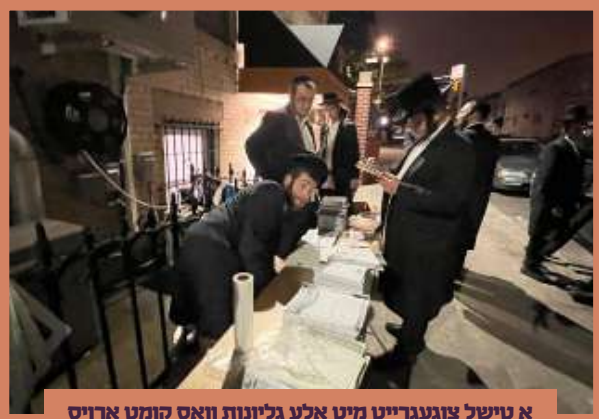
א טישל צוגעגרייט מיט אלע גליונות וואס קומט ארויס אין היכל הקודש - ליל ששי במדבר אין בארא פארק