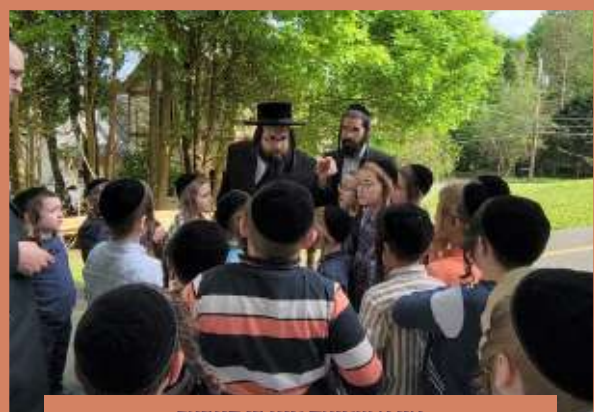
אין א שמועס מיט די קינדער