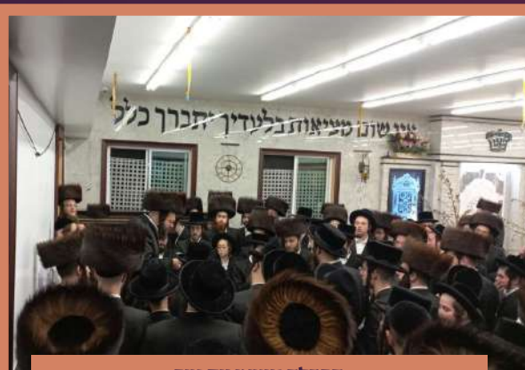
הבדלה מוצאי יום טוב