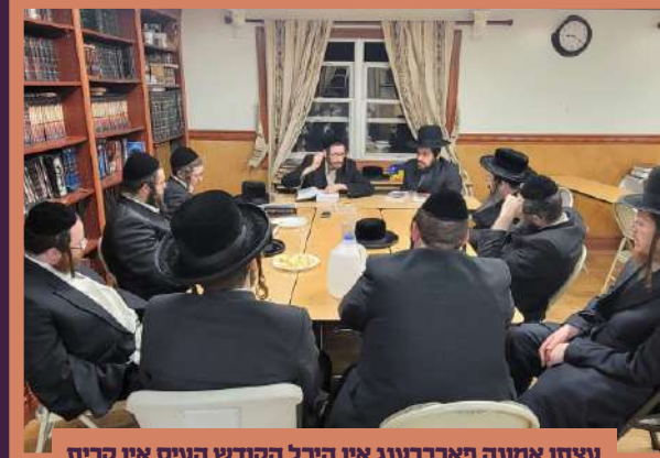
עצתו אמונה פארברענג אין היכל הקודש העיס אין קרית יואל - ג' בחוקותי