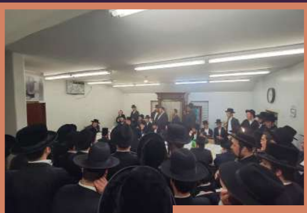
ראש חודש סעודה מיטן ראש ישיבה אין היכל הקודש לעיקוואד - א' במדבר