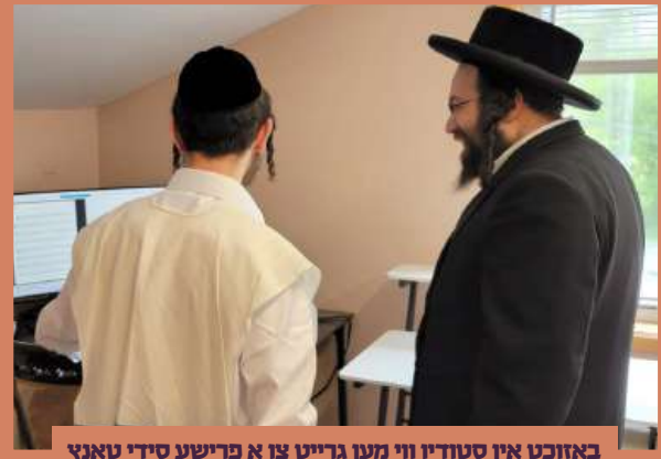
באזוכט אין טודיו ווי מען גרייט צו א פרישע סידי טאנץ מיט אמונה