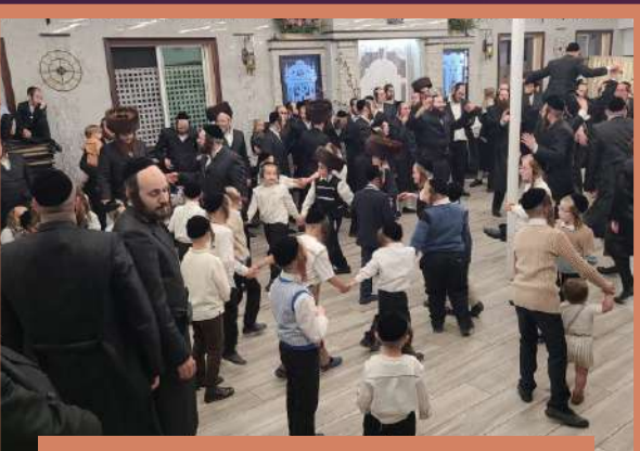
די קינדער טאנצן צחאמען