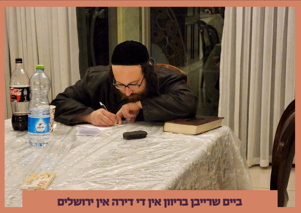
ביים שרייבן בריוון אין די דירה אין ירושלים