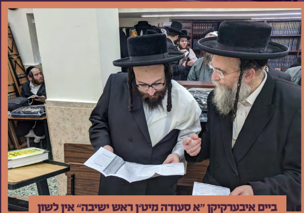
ביים איבערקוקן "א סעודה מיטן ראש ישיבה" אין לשון קודש