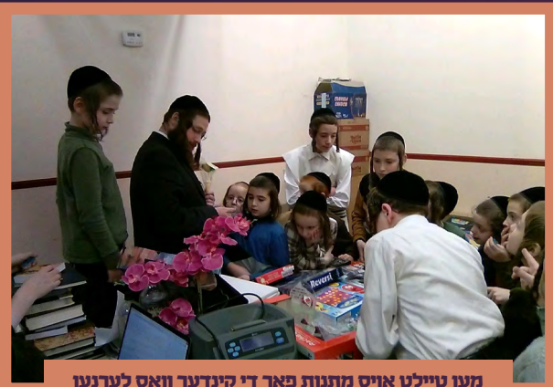
מען טיילט אויס מתנות פאר די קינדער וואס לערנען סדר דרך הלימוד אין זייטיגע צייטן