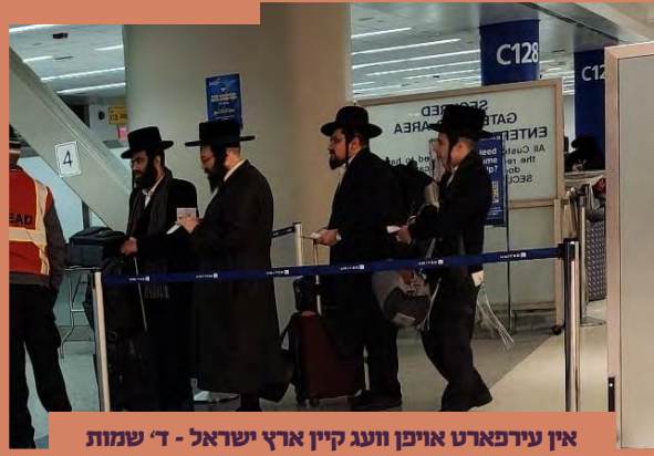
אין עירפארט אויפן וועג קיין ארץ ישראל - ד' שמות