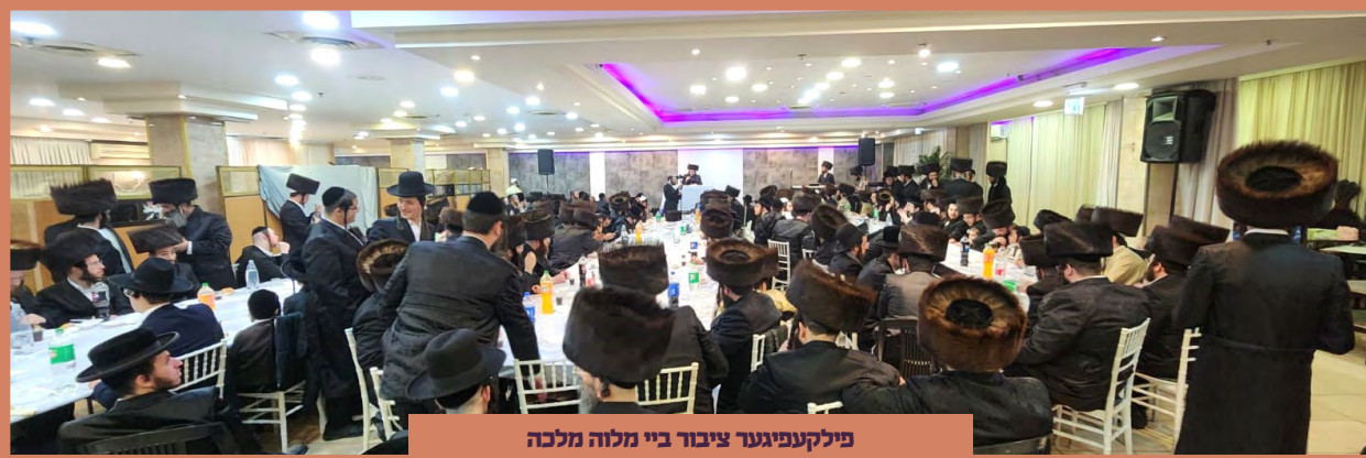
פילקעפיגער ציבור ביי מלוה מלכה