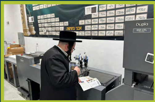
ביים איבערקוקן די קרית ברסלב בלעטל