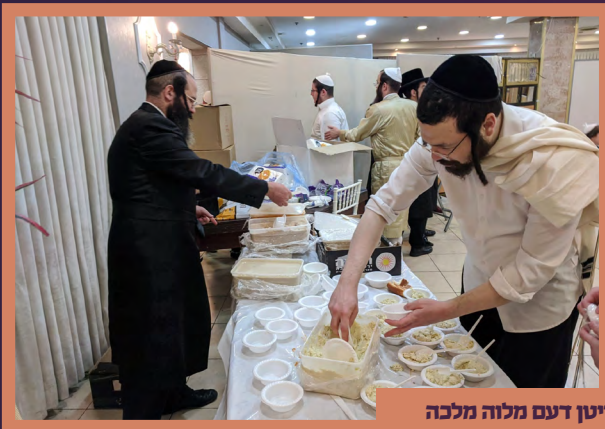
אנשי שלמינו העלפן אנגרייטן דעם מלוה מלכה