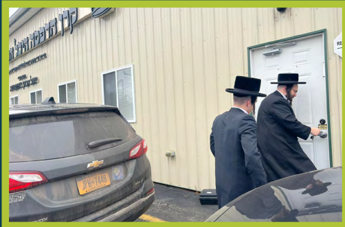
ביים אנקומען צום בית הדפוס - ג' שמות