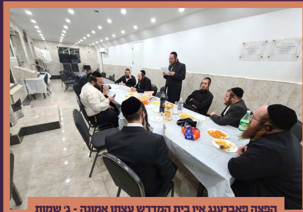
הפצה פאברענג אין בית המדרש עצתו אמונה - ג' שמות