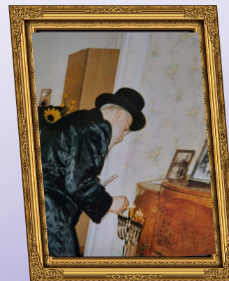
אויפן בילד: "מיין זיידע ביי חנוכה ליכט צינדן"

דער אייבערשטער זאל העלפן איך זאל אויך אלעמאל זיין פרייליך, און ליב האבן די הייליגע מצוות.