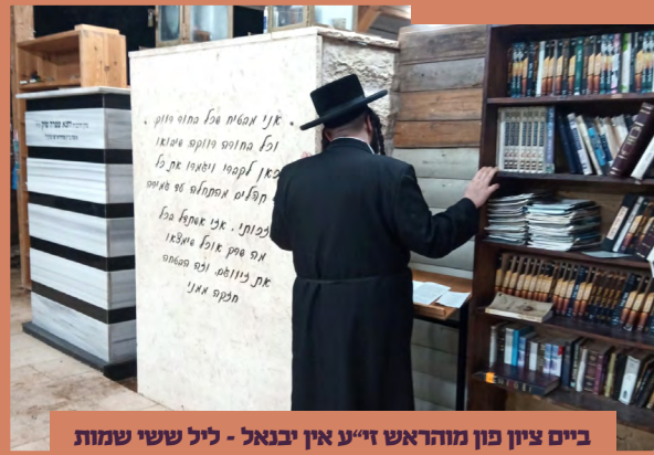
ביים ציון פון מוהראש ז"ע אין יבנאל - ליל ששי שמות