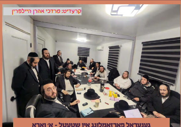
גענעראל פארזאמלונג אין שטעטל - א' ווארא