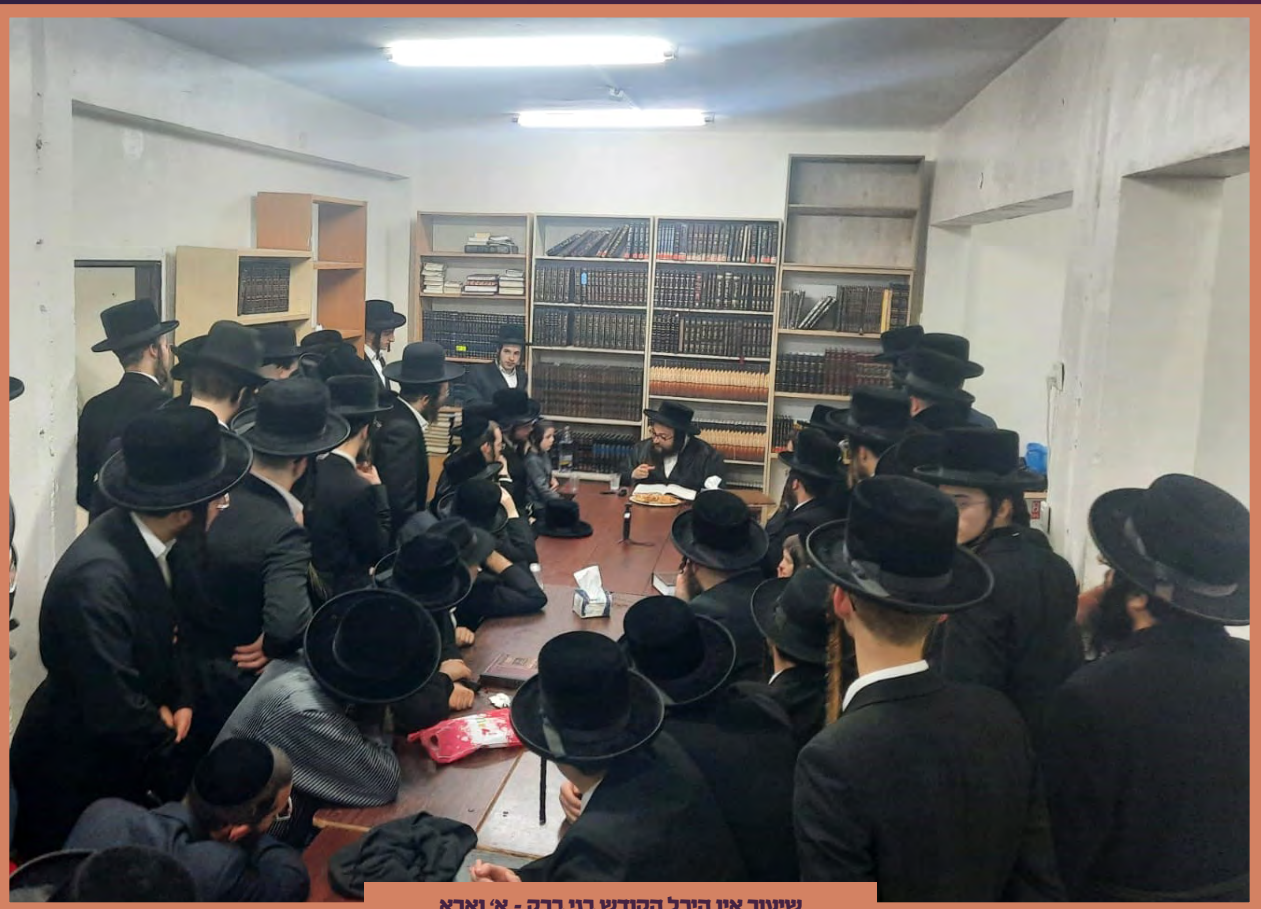
שיעור אין היכל הקודש בני ברק - א' וארא