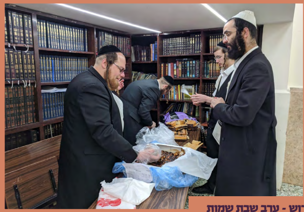
מען גרייט אן קיכן פאר די קידוש - ערב שבת שמות