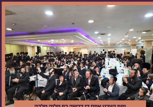
מען הערט אויס די דרשה ביי מלוה מלכה