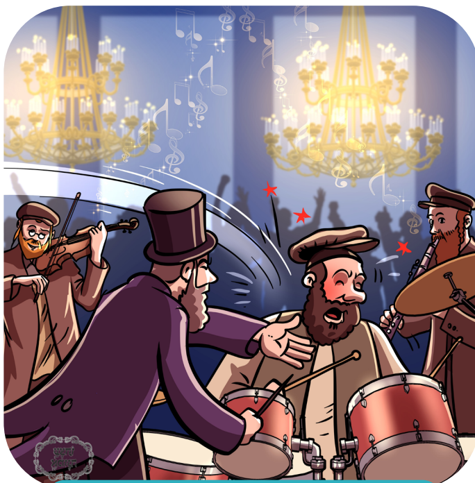
דער פויקער פויקט ווייטער

פּלוצלונג: "פּאַטש!!!!" "פּאַטש!!!!" דער קאַנדאַקטער האָט געגעבן אַ פּאַטש פּאַרן