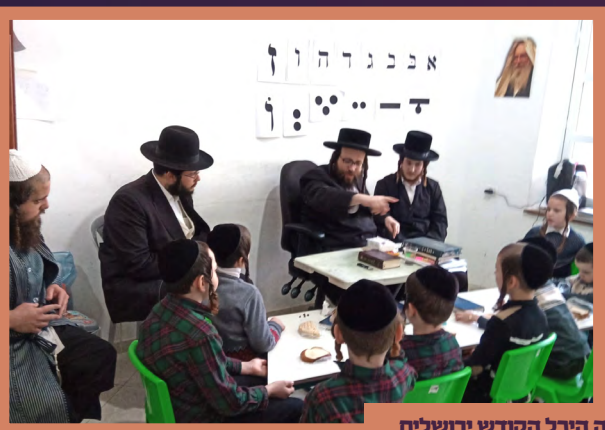
ביים באזוכן אין תלמוד תורה היכל הקודש ירושלים זונטאג וארא