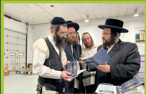
ביים איבערקוקן דעם ליקוטי מוהר"ן מיטן פירוש שפתי חפוח