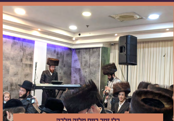
כלי זמר ביים מלוה מלכה