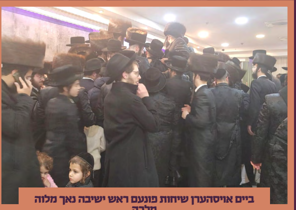
ביים אויסהערן שיחות פונעם ראש ישיבה נאך מלוה מלכה