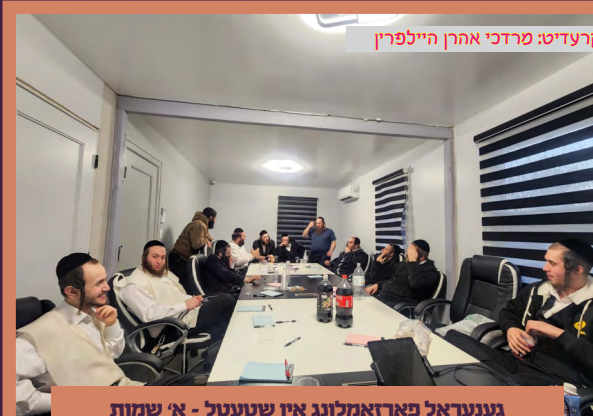
גענעראל פארזאמלונג אין שטעטל - א' שמות