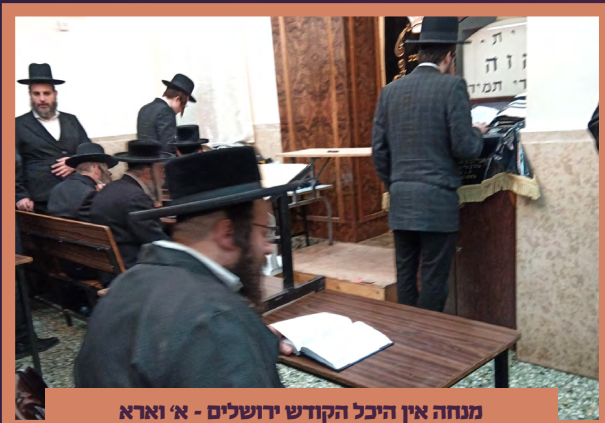
מנחה אין היכל הקודש ירושלים - א' וארא