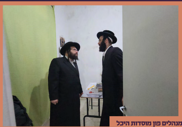
ביים רעדן צו די מלמדים און מנהלים פון מוסדות היכל הקודש ירושלים אין טברי'