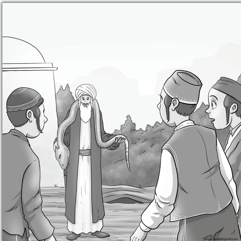
רבי חנינא בן רופא עם החיה המתה

אבל אם לא עושים עברות, ואם חס ושלום עשו עברה מיד חוזרים בתשובה, מבקשים סליחה מהשם יתברך, אומרים: 'רבנו של עולם, תסלח לי, אני כבר הולך להיות טוב'; אזי לא צריכים לפחד משום דבר, לא מנחשים ולא מדבים, אף אחד לא יכול לעשות רע לאדם."