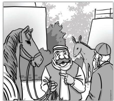
מיין גוטער חבר, איך נעב דיר אונזען מיין פערד