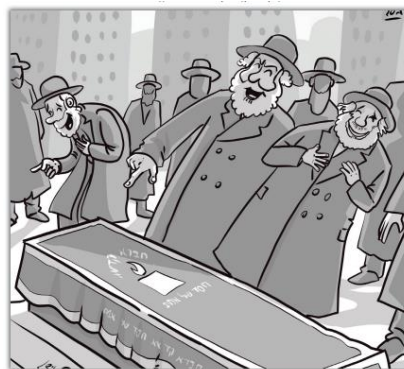
הא הא, דער קארנער עושר!

די וואך האבן מיר געליינט די מעשה פון עצתו אמונה פאר קינדער פרשת שמות תשפ"ב פון די עושר וואס יעדער האט געמיינט אז ער איז קארג אבער עכט פלעגט ער געבן צדקה באהאלטענערהייט.