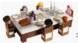
ענטפערס פון לעצטע וואך:

מעג איך אריינלייגן לאקשן אין א טאפ זופ אויפן פלאם? מעג איך איינטינקען א שטיקל חלה אין מיין טעלער זופ? מעג איך סערווירן זופ מיט א נאסע שעפלעפל?