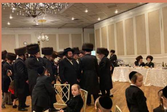
דער ראש ישיבה ביים חתונה פון ר' אלימלך פארגעס הי"ו - ד' תצוה אין קרית יואל