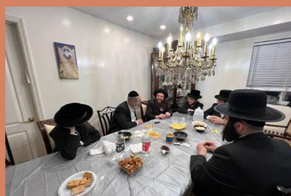
עצתו אמונה פארברענג אין וויליאמסבורג - ב' תצוה