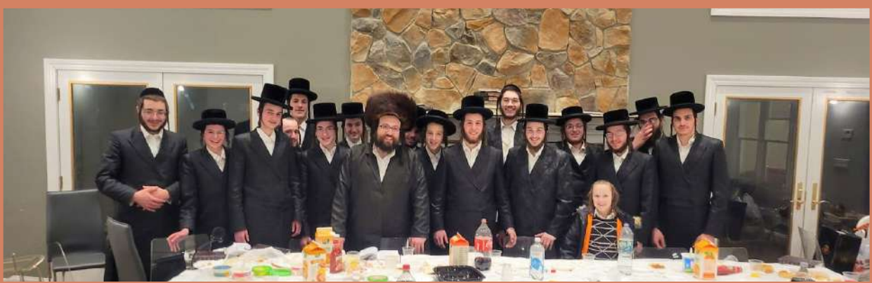
שבת התועדות מיט די בחורים וואס האבן אריינגעברענגט א געוויסער סכום געלט פאר די ישיבה - שבת תצוה תשפ"ב