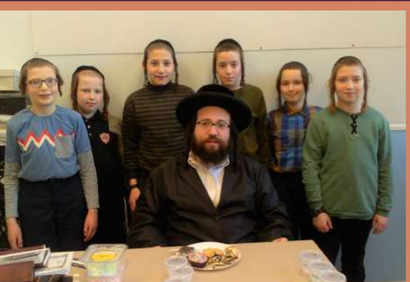
סיום מסכת מועד קטן מיט די עלטערע קינדער אין וויליאמסבורג