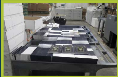
הגדה של פסח אין אידיש ארויס פון דרוק