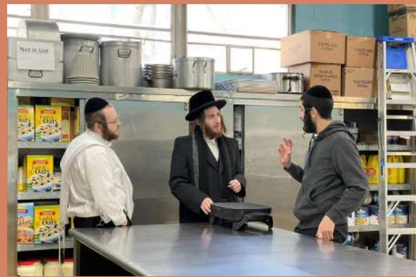
דער דיין שליט"א ביים באקוקן דעם קאך אין תלמוד תורה קריית ברסלב ליבערטי - דאנערשטאג תצוה