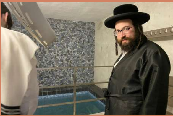
דער ראש ישיבה באזוכט מקוה מלכה - ד' תצוה