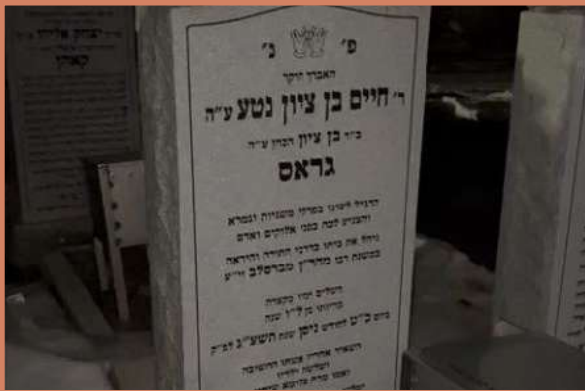
דער ראש ישיבה ביים ציון פון האברך חיים בן ציון נטע גראס ע"ה - תלמוד היכל הקודש