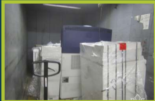
עס קומט אן נייע מאשינען ביים בית הדפוס אין ישיבה אפאר יאר צוריק