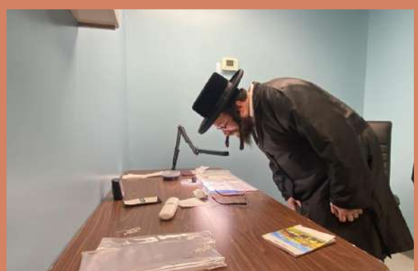
ביים באטראכטן דעם מגילה וואס ר' שלום נ"י שרייבט