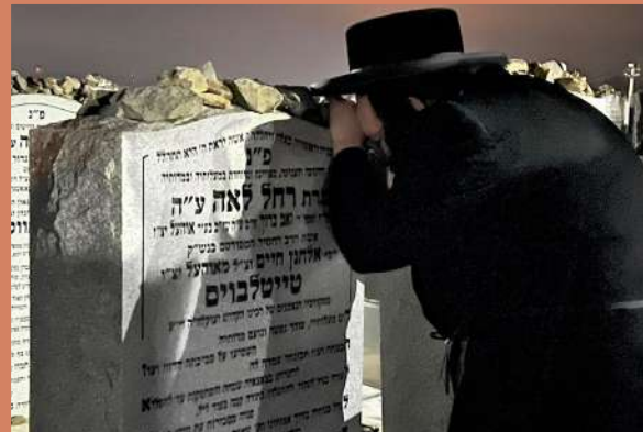
דער ראש ישיבה ביים ציון פון זיין באבע רחל לאה ע"ה - וואס די יארצייט איז געמאלן דעם טאג ט' אדר.