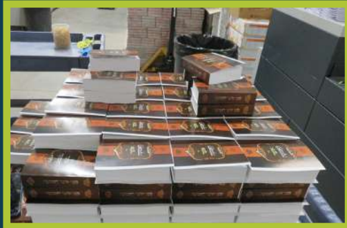
ספר אוצר האמונה ארויס פון דרוק