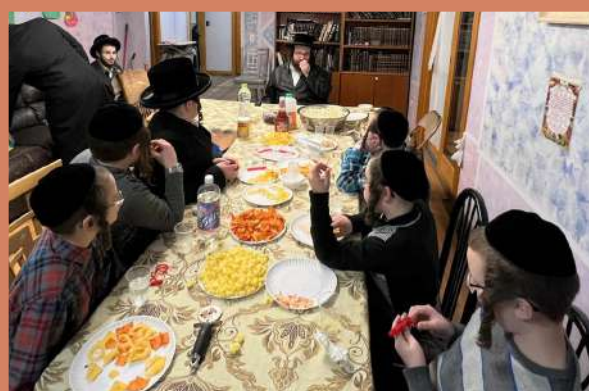
סיום מסכת מועד קטן מיט די עלטערע קינדער אין שטעטל