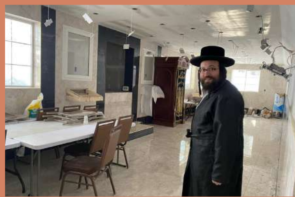
דער ראש ישיבה באזוכט אין בית המדרש עצתו אמונה - ד' תצוה