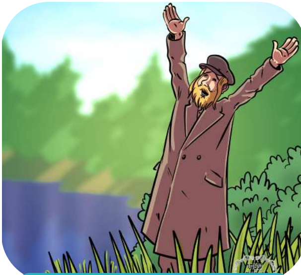
צינד עס אן אין מיין הארץ

האבן א געפיל מיין גאנץ לעבן אין רבי'ן. אויפ'ן וועג אהיים פון רבינ'ס שטוב, האט ער געזען דעם בוג, בוג איז א נאמען פון א טיף וואס גייט אריבער דעם שטעטל ברסלב; רבי נתן האט זיך אנוועקגעזעצט ביים טיף בוג און אנגעהויבן בעטן דעם אייבערשטן, ער האט געזינגען: "אין ברסלב ברענט א פייער, צינד עס אן אין מיין הארץ, אין ברסלב ברענט א פייער, צינד עס אן אין מיין הארץ", אזוי האט ער געזינגען א גאנץ פרייטאג צו נאכטס.