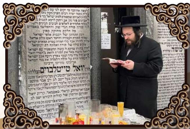
ביים ציון פון הרה"ק מסאטמאר זצ"ל ד תצוה תשפ"ב

קלאסיפייט אפטיילונג: מודעות, ארבעט, גמחים און נאך.