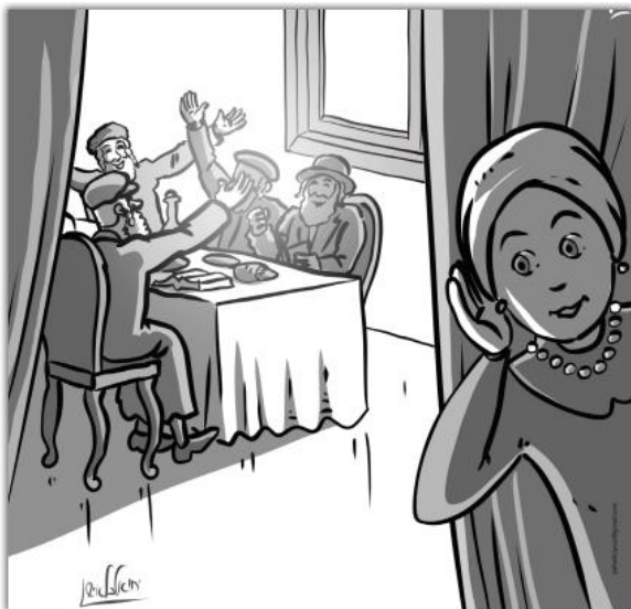
"מיין טאטנ'ס מענטשן מענטשן אויפ'ן קול"

די וואך האבן מיר געליינט אזא שיינע מעשה וואס דער ראש ישיבה האט געשריבן אין עצתו אמונה פאר קינדער.