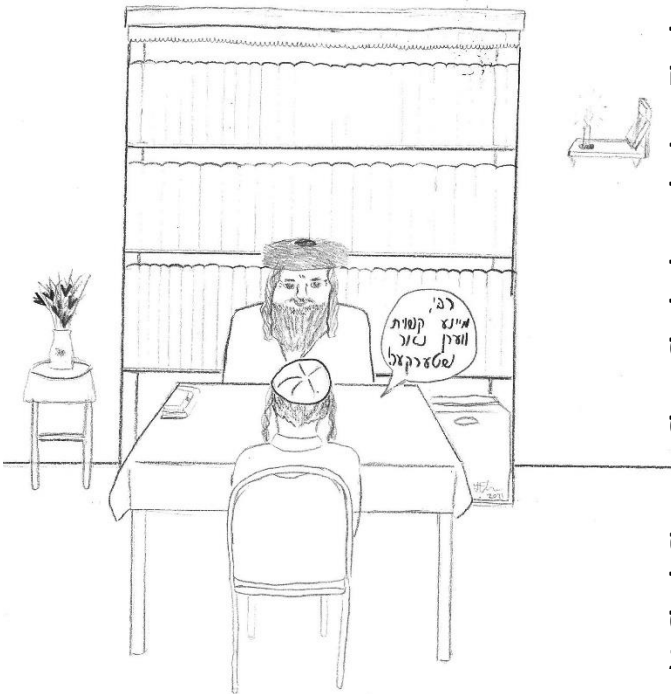
פארזעצונג קומט אי"ה... פריער: און פארזעצונג קומט אי"ה... פריער: און פארזעצונג קומט אי"ה...