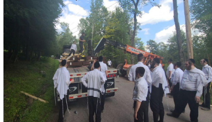
סיום מסכת שבת ב' ראה נאכ'ן טעגליכן שיעור