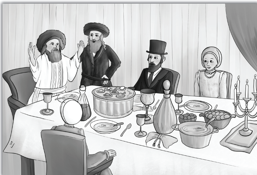
"וועל איך דינען דעם אייבערשטן און קיין זון ערו!"

עפֿעס איז געשען מיטן הייליגן בעל שם טוב, עפֿעס שלעכט; דער הייליגער צדיק איז פֿלוצלונג געווארן ווייס ווי