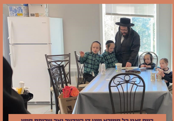
ביים זאגן כל חמירא מיט די קינדער נאך שריפת חמץ