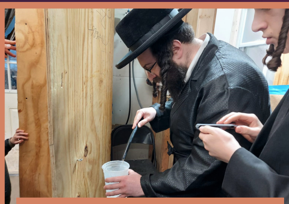
מים שלנו ערב פסח אין מצה בעקעריי