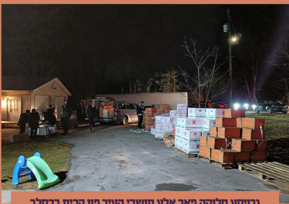
גרויסע חלוקה פאר אלע תושבי העיר פון קרית ברסלב