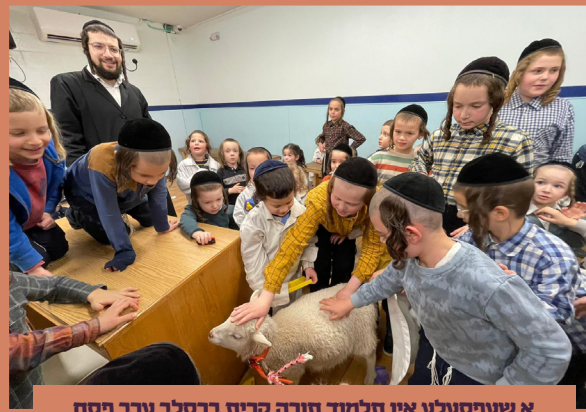
א שעפסעלע אין תלמוד תורה קרית ברסלב ערב פסח