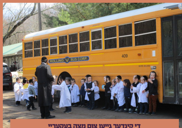
די קינדער גייען צום מצה בעקעריי