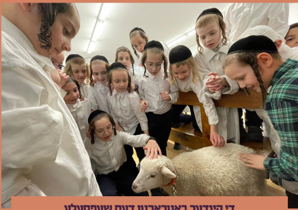
די קינדער באטראכטן דעם שעפסעלע