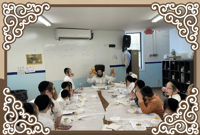
א סדר אין תלמוד תורה קרית ברסלב

א סעודה מיטן ראש ישיבה שליטי"א: איך וויל מער נישט האבן קיין קשיות אויפן אייבערשטן