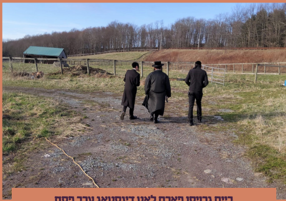
ביים גרויסן פארם לאט דינסטאג ערב פסח