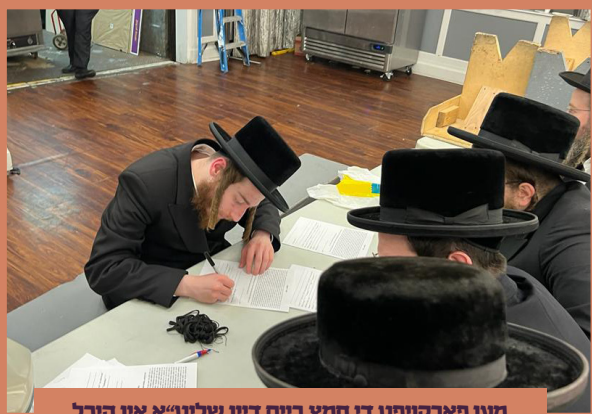
מען פארקויפט די חמץ ביים דין שליט"א אין היכל הקודש וויליאמסבורג