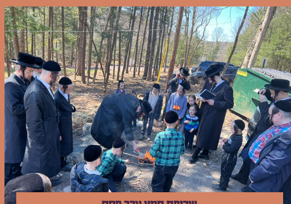
שריפת חמץ ערב פסח