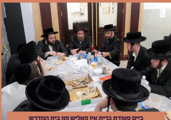
ביים סעודת ברית אין פאליש פון בית המדרש