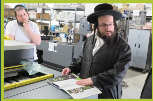
דער ראש ישיבה באטראכט דעם פסח בלעטל אין בית הדפוס