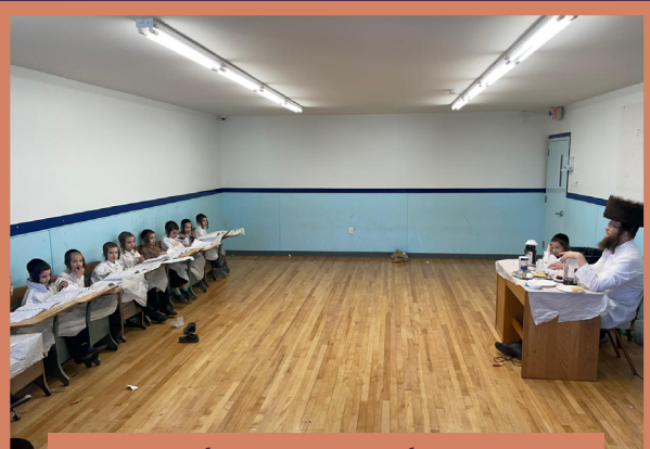
א סדר אין תלמוד תורה קרית ברסלב כיתה ד'