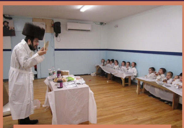
א סדר אין תלמוד תורה קרית ברסלב קינדערגארטן