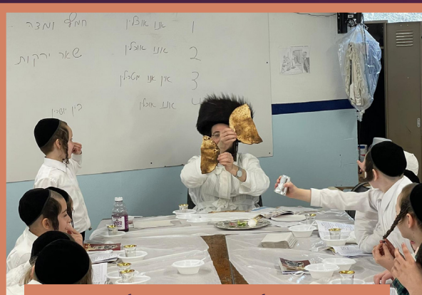
א סדר אין תלמוד תורה קרית ברסלב כיתה ה'