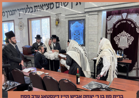
ברית פון בן ר' יצחק אביש הי"ד דינסטאג ערב פסח