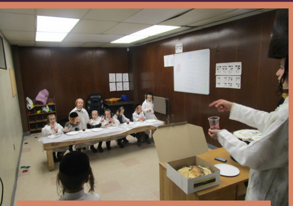
א סדר אין תלמוד תורה קרית ברסלב כיתה א'