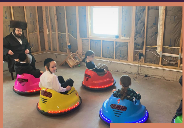
מיט די קינדער אינעם פארק "טאנץ מיט אמונה"