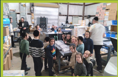
תלמוד תורה היכל הקודש קרית יואל באזוכט אין בית הדפוס