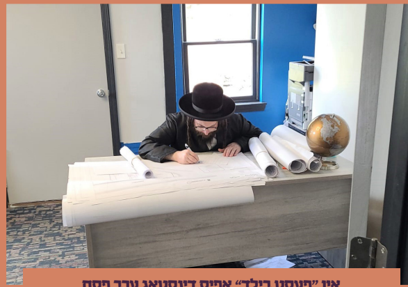
אין "פעסט בילד" אפיס דינסטאג ערב פסח