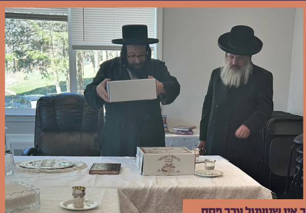
ביים מאכן די ברכה אויפן עידוב אין שטעטל ערב פסח