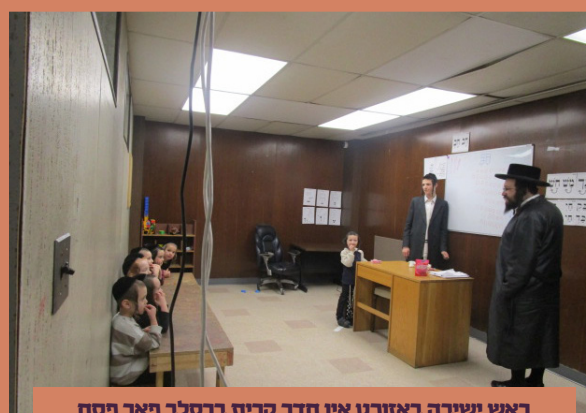
ראש ישיבה באזוכט אין חדר קרית ברסלב פאר פסח