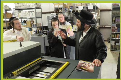
ביים שמועסן מיט די ארבעטערס אין בית הדפוס