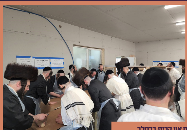
מען באקט מצות ערב פסח אין קרית ברסלב