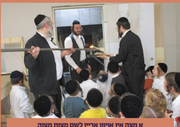
אי מצה אין אויוון אריין לשם מצות מצוה