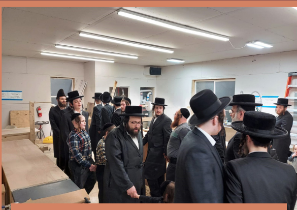
פרייליכע טעג נאך מים שלנו