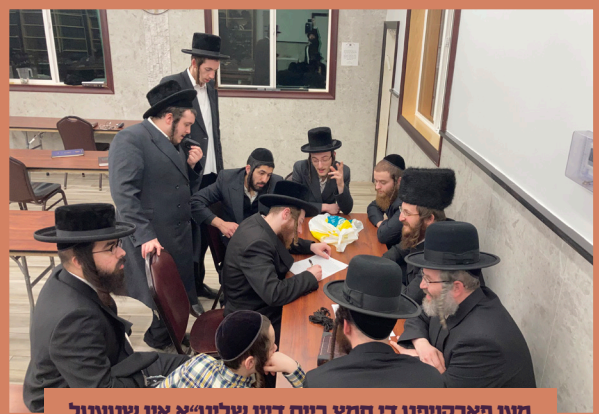
מען פארקויפט די חמץ ביים דין שליט"א אין שטעטל