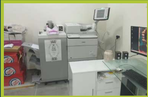
נייער בית הדפוס עצמו אמונה אין שטאט יבנאל עיר ברסלב