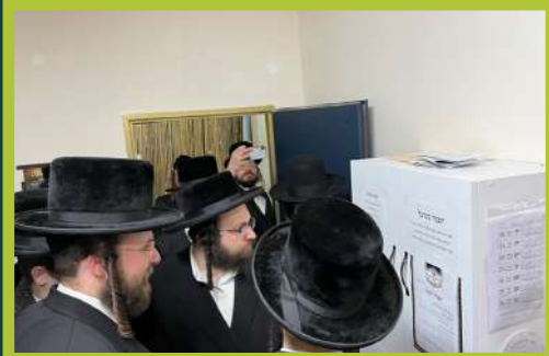
דער ראש ישיבה באטראכט הפצה סענטער אין היכל הקודש בני ברק ביי די באזוך אין ארץ ישראל פרשת שמיני תשפ"ב