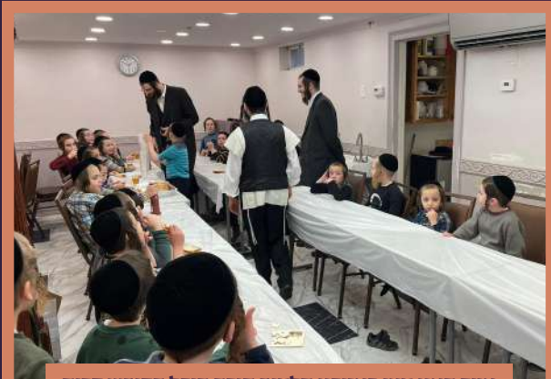
אויך האט מען באזוכט תלמוד תורה היכל הקודש קרית יואל, און געגעסן דארט א פייערעם לאנטש