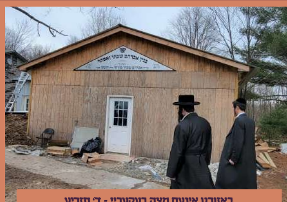
באזוכט אינעם מצה בעקעריי - ד' תזריע