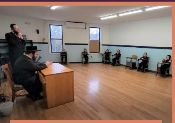
דער ראש ישיבה באזוכט תלמוד תורה קרית ברסלב כיתה ב' - ד' תוריע