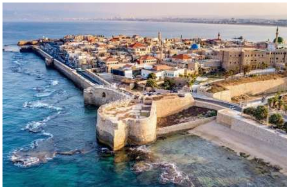
די שטאט עכו היינטיגע צייטן

דער לאנד רעגאז [היינט איז עס ראגוזא, וואס איז א טייל פון די סיציליע אינזל] האט זיך דאן געהאלטן אין גוטן מיט אלע לענדער, און דער סדר איז געווען דעמאלט אז ווען די קריג'ס שיפן זענען געפארן אויפ'ן ים, פלעגן זיי כאפן אין געפענגעניש אויך ציווילע שיפן פון אנדערע לענדער מיט אלע מענטשן וואס האבן זיך געפונען דערויף. ווען די שיפן פון רעגאז האבן אבער ארויפגעשטעלט זייער פאן אויפ'ן שיף, האט מען זיי נישט געכאפט אין געפענגעניש, און דערפאר האט דער רבי געשיקט דינגען א פלאץ אויף אזא שיף פון רעגאז. דער שליח איז טאקע אהינגעגאנגען און געקויפט א בילעט פאר'ן רבי'ן, אויף א שיף פון רעגאז.