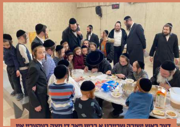
דער ראש ישיבה שרייבט א בריוו פאר די מצה בעקעריי אין תלמוד תורה קרית ברסלב - ד' תזריע