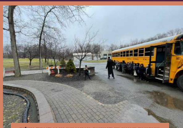
דערנאך זענען די קינדער געגאנגען צו א פארק צוליב וואס זיי האבן זיך אויסגעצייכנט מיט די לימודים