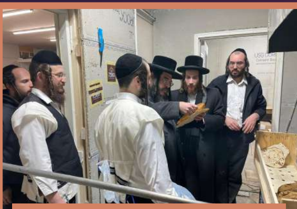
חשובע דיינים שליט"א באוואונדערן די מהודר'דיגע מצות