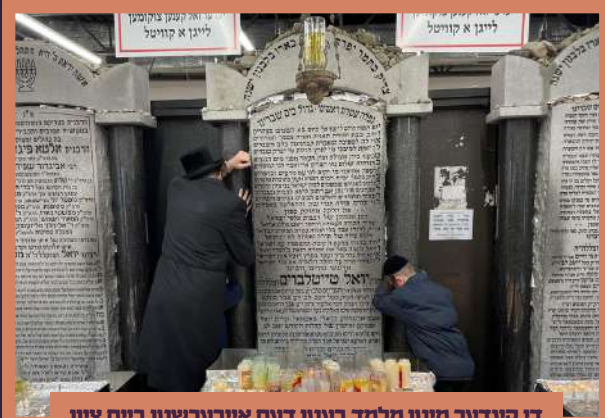
די קינדער מיטן מלמד בעטן דעם אייבערשטן ביים ציון אויף די אייגענע שפראך, פאר זיך און פאר כלל ישראל