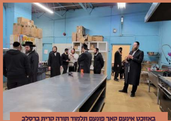
באזוכט אינעם קאך פונעם תלמוד תורה קרית ברסלב