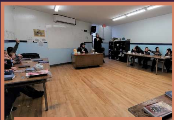
דער ראש ישיבה באזוכט תלמוד תורה קרית ברסלב כיתה ה' - ד' תוריע