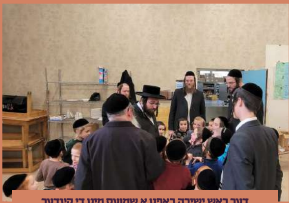
דער ראש ישיבה כאפט א שמועס מיט די קינדער