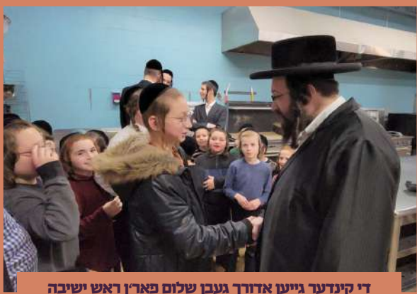
די קינדער גייען אדורך געבן שלום פארן ראש ישיבה