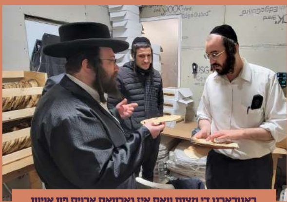
באטראכט די מצות וואס איז נארוואס ארויס פון אויוון