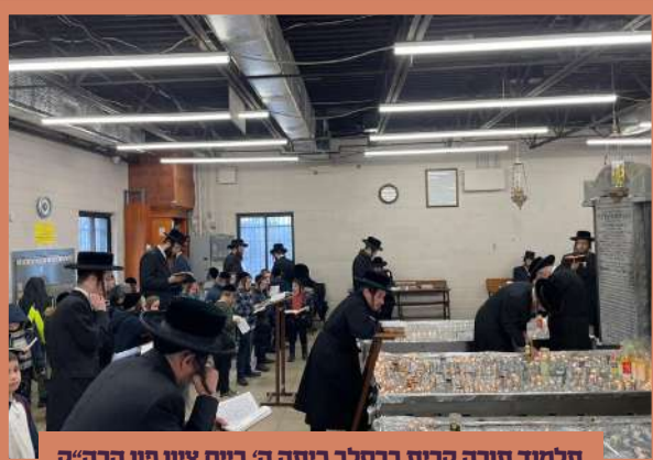
תלמוד תורה קרית ברסלב כיתה ה' ביים ציון פון הרה"ק מסאטמאר ז"ע אין קרית יואל - ה' שמיני תשפ"ב