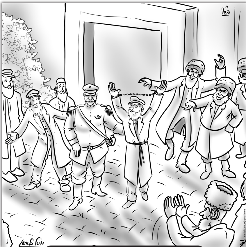
מיט הפצה וועט איר מיר העלפן

דער הייליגער רבי נתן האט זיך נישט פארלוירן; ער איז