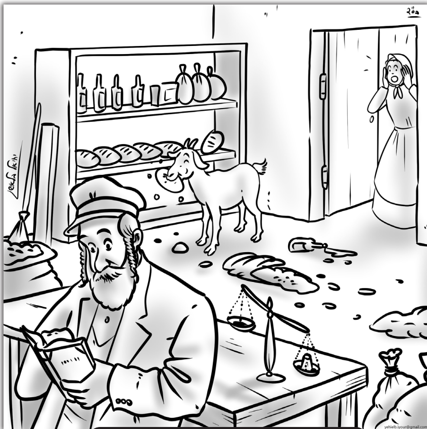
דער ציג עסט מיט גרויס אפעטיט