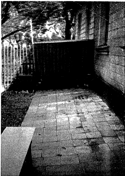
LA TUMBA DEL SANTO RABI NAJMAN DE BRESLEV EN LA CIUDAD DE UMAN